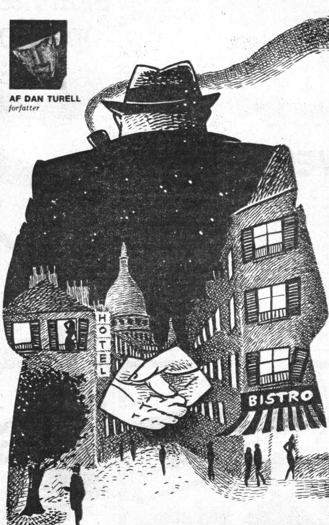
(Tegning: Peder Bundgaard)

Hos Simenon har det aldrig været sådan. Hvad en Simenon-bog, hvad faktisk hver eneste Simenon-bog handler om, er en indtrængning i et menneske — i et menneske eller i et miljø.