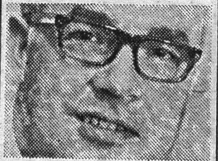
VED PER HANGHØJ

der er finere eller fornemmere end nogen anden. Det eneste der tæller ved musik, er om den giver den, der hører den, noget — en glæde, en befrielse, en bevidsthedsudvidelse, måske en lyst til at danse eller synge med.