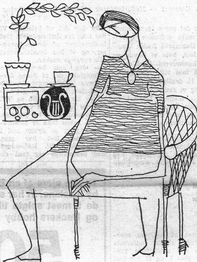
Tegning: Erik Stender

Min mor sparede hemmeligt op i ti år, sparede hemmeligt op af de små husholdningspenge, dag efter dag i ti år — for at kunne holde 'et pænt sølvbryllup' for familien'.