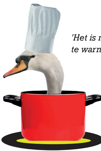
"Het is me hier te warm...!"

't Spaans Tolhuis is het laatste gebouw van het 17de-eeuwse Spaans fort dat ooit de sluis bewaakte. Binnen werden onlangs graffiti teruggevonden van soldaten die in 1706 het fort bezet hielden. Momenteel wordt het als beschermd monument gerestaureerd en is het een wandel- fiets- en vaarstop met groot tuinterras. Je kunt 't Spaans Tolhuis vrij bezoeken. Volg de wegwijzers.