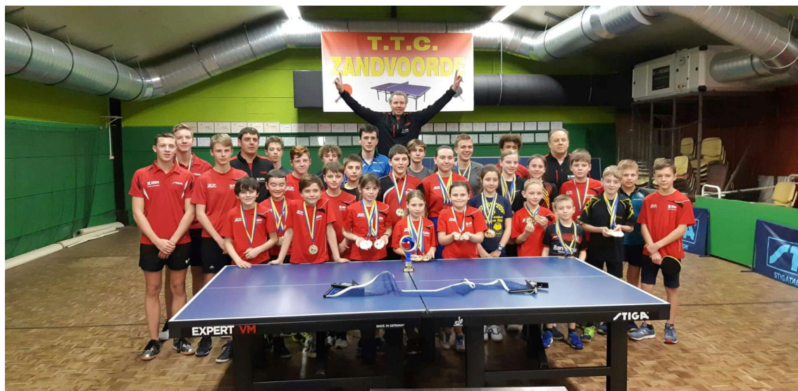
Foto voor De Zeewacht met onze talrijke medaillewinnaars op het PK 2020.