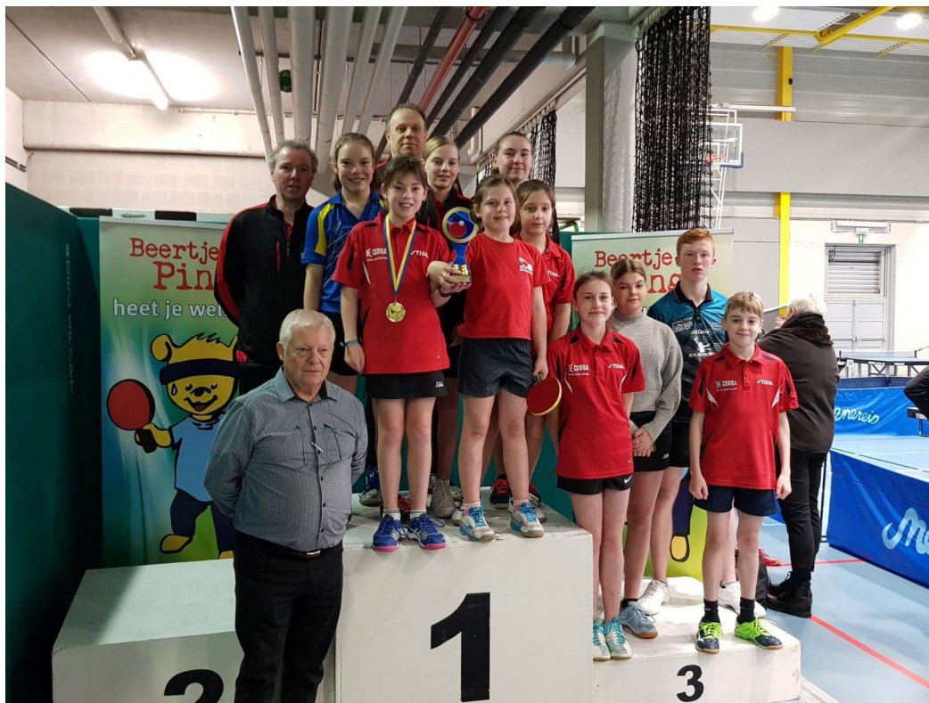
Op het provinciaal kampioenschap (04/01/2020 – 05/01/2020) behaalde TTC Zandvoorde de beker voor beste jeugdclub .