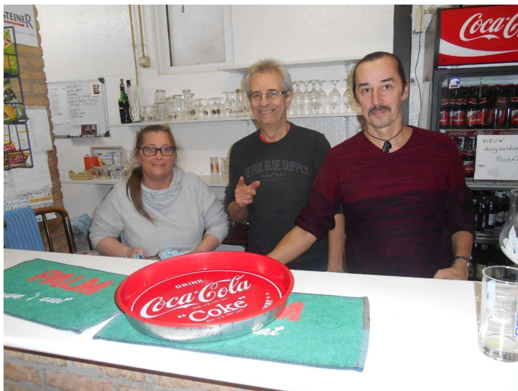
Enkele van de helpende handen achter bar