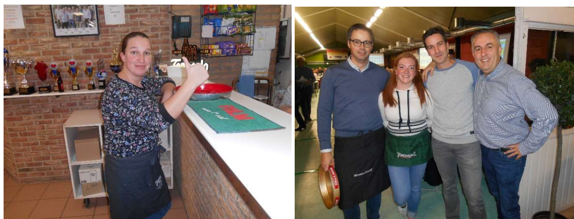
Enkele van de helpende handen voor de bar