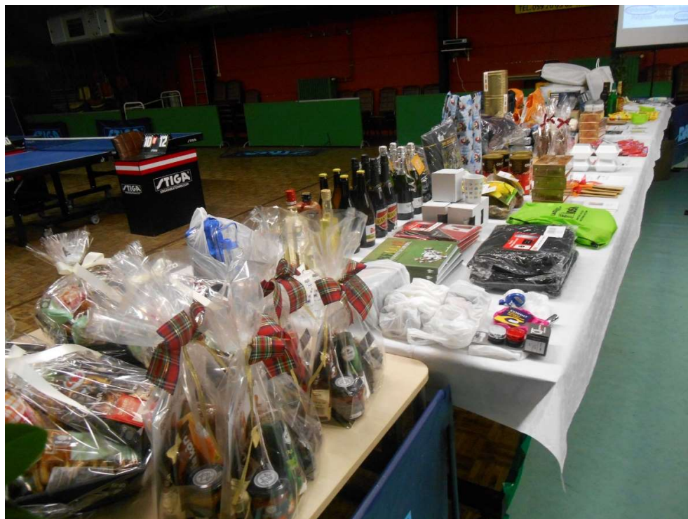
De volle prijzentaal t.w.v. meer dan € 2.000