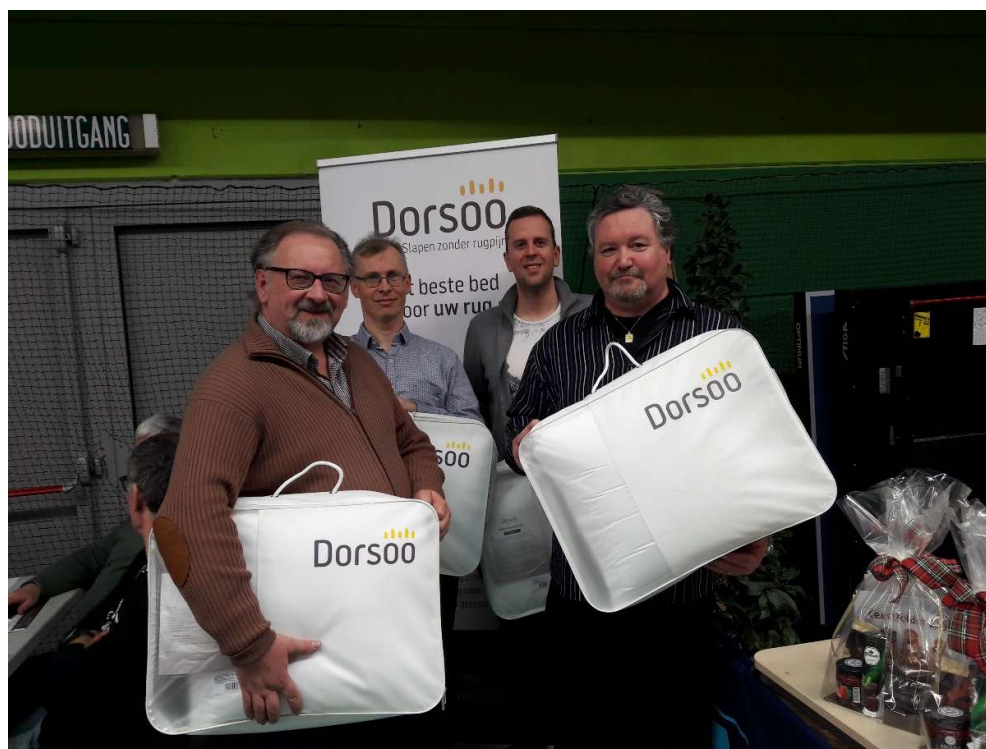
TTC Eernegem, gestrand op 0,8% van de eerste plaats