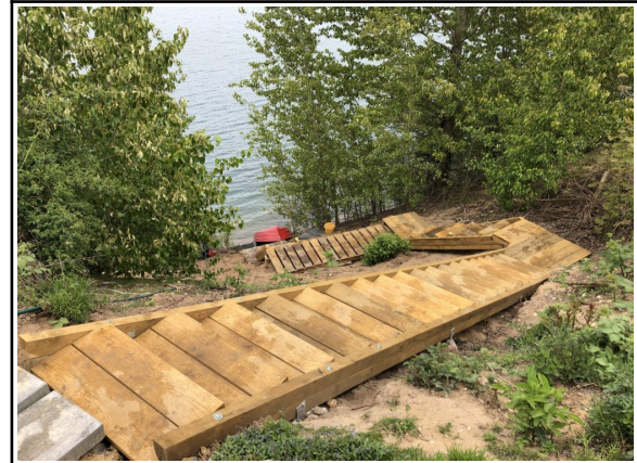
Einstieg 1 [ https://www.vip-dive-center.de/ ]