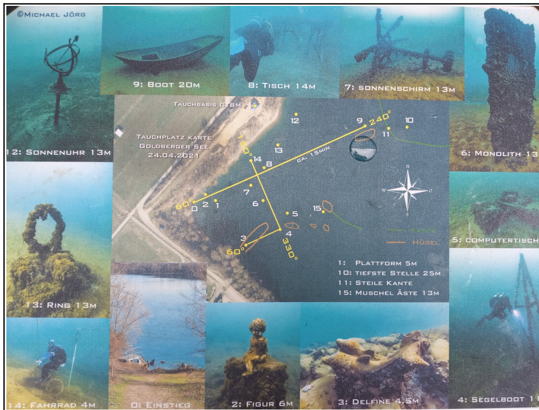
Tauchplatzkarte groß [ https://www.gtbmtauchen.de/ ]

Alle wesentlichen Informationen zum Tauchgewässer „Goldberger See“ und der Tauchbasis „GTBM GmbH“ findet ihr unter folgendem Link: Tauchbasis GTBM Goldberger See.