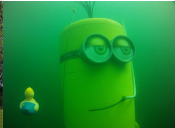
2 Bilder