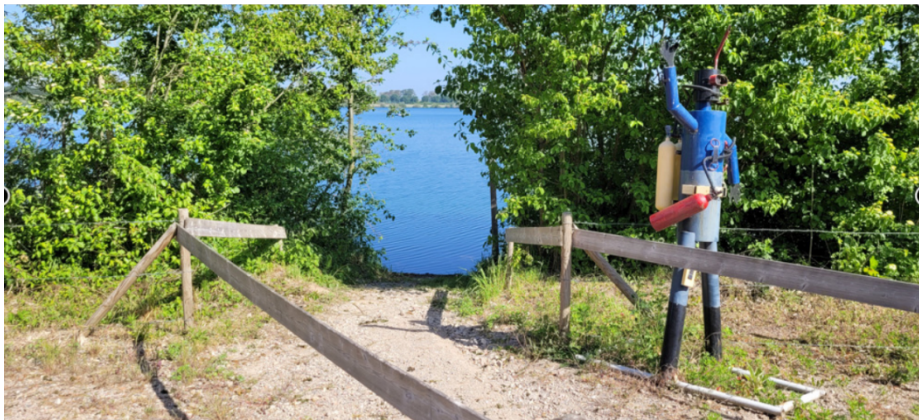
Einstieg III