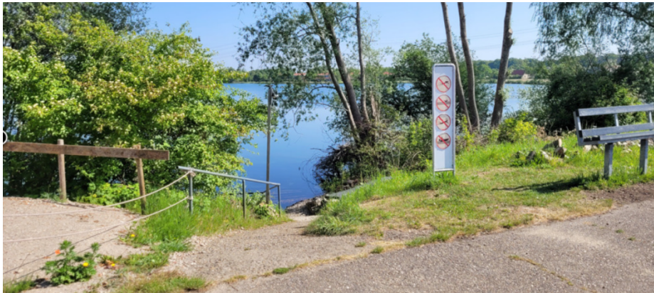
Einstieg II