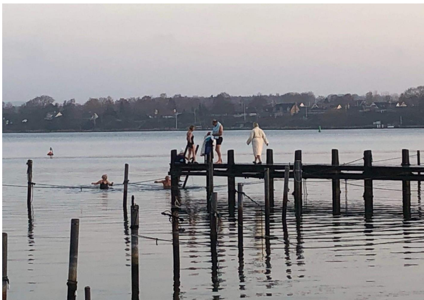
Ved Badstuebroen mødes dagligt en gruppe friske morgenbadere.