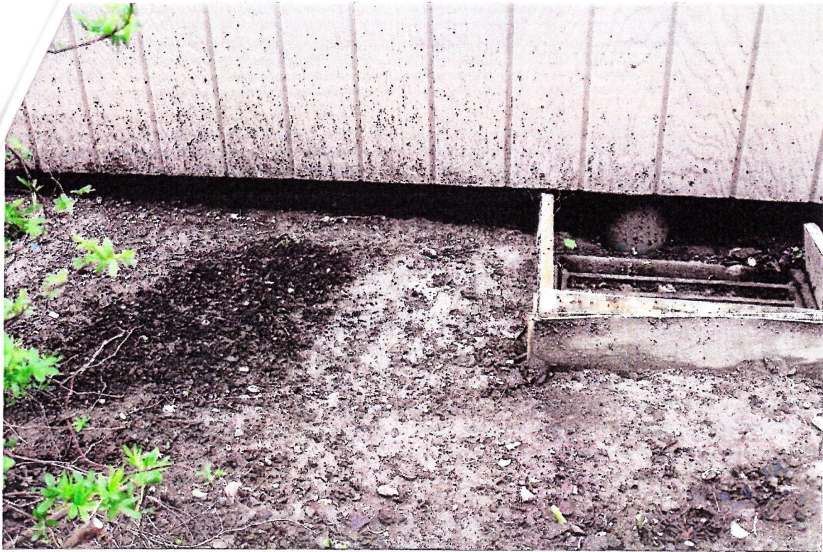
Pop 39. d 28.05.18