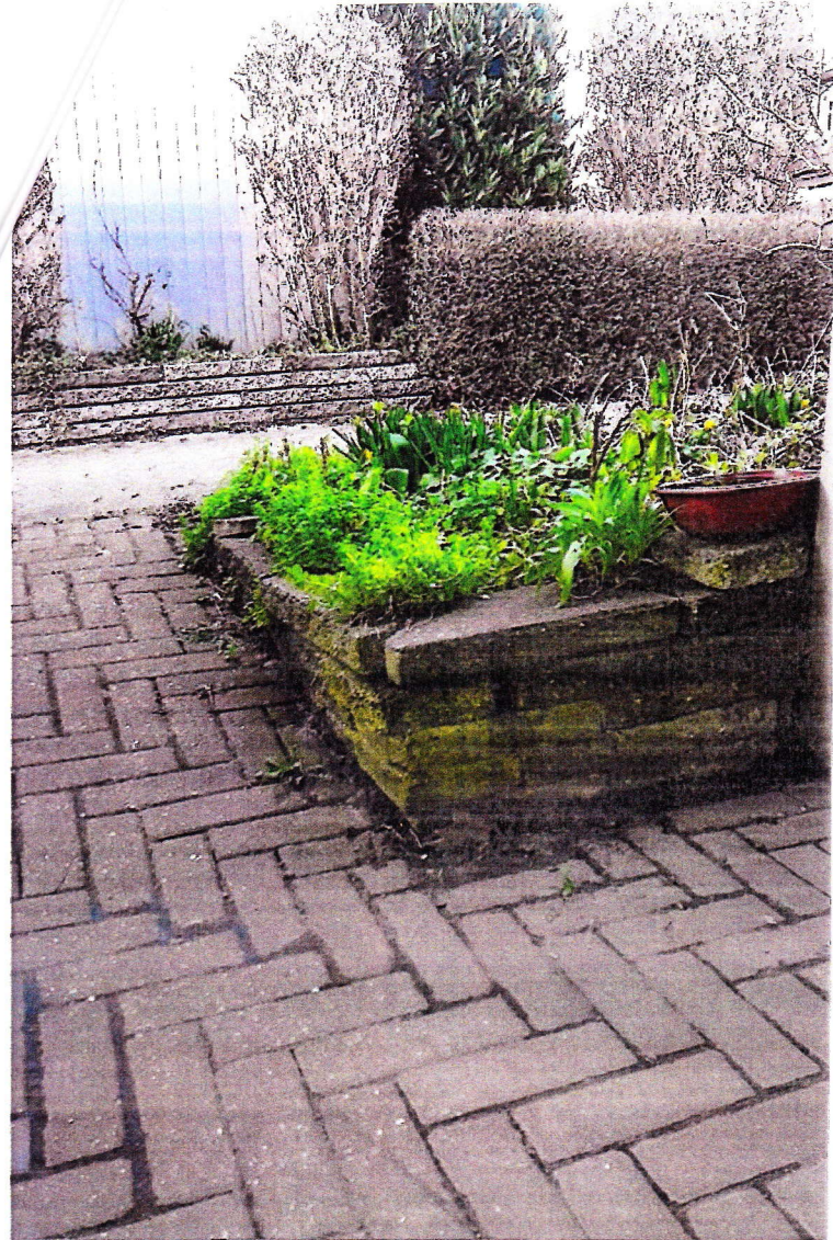
Pop 35. d 28.02.20