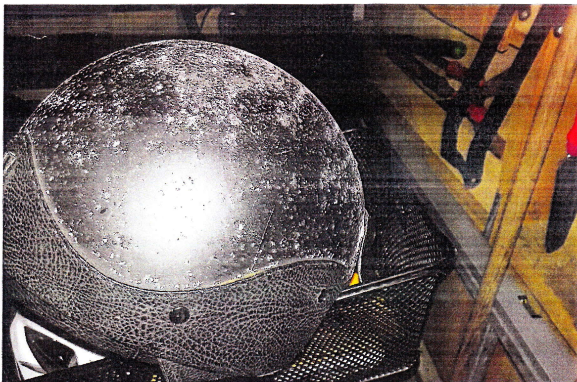
Pop 39. d. 28.02.20