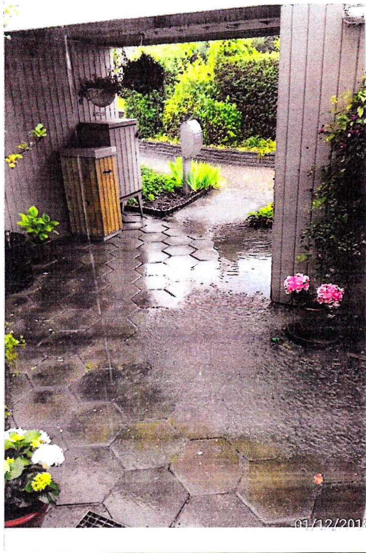
Pop 43. d 01.12.18