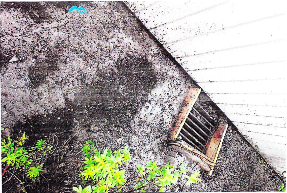
Pop 39. d. 28.05.18