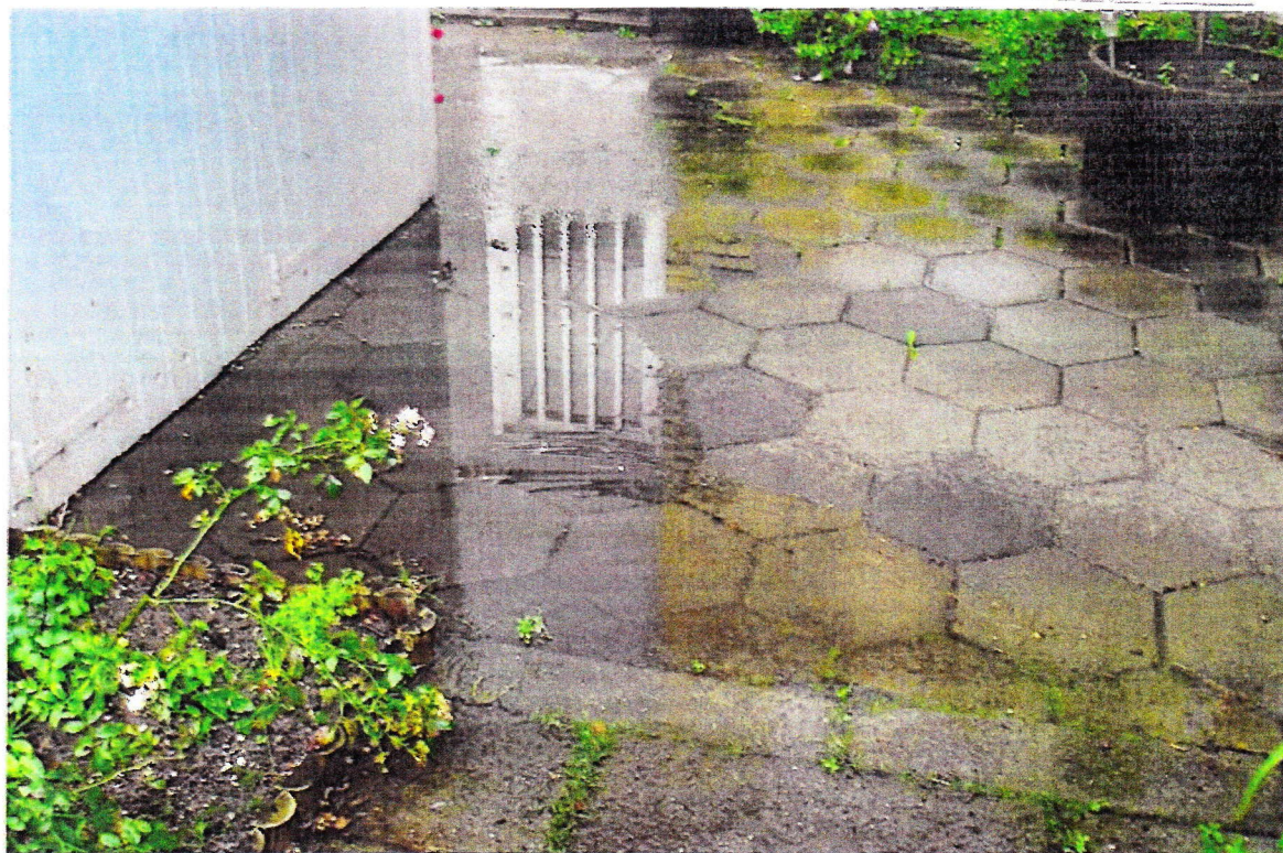
Pop 43. d. 14.08.19