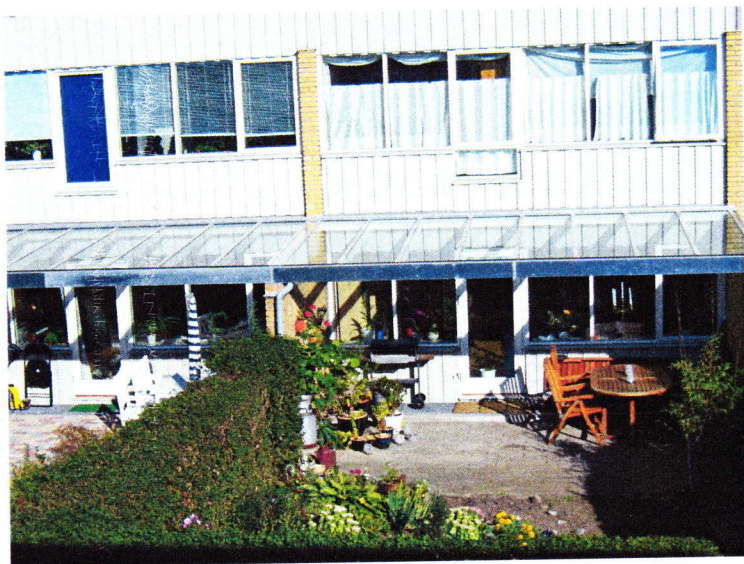
Eksempel 3 - Overdækning til terrasse: Tagflade med 10 mm glas i 8 fag.

Tagrenden skal udføres skjult bag stern. Afvanding til terræn må ikke kunne løbe ind på naboens grund.