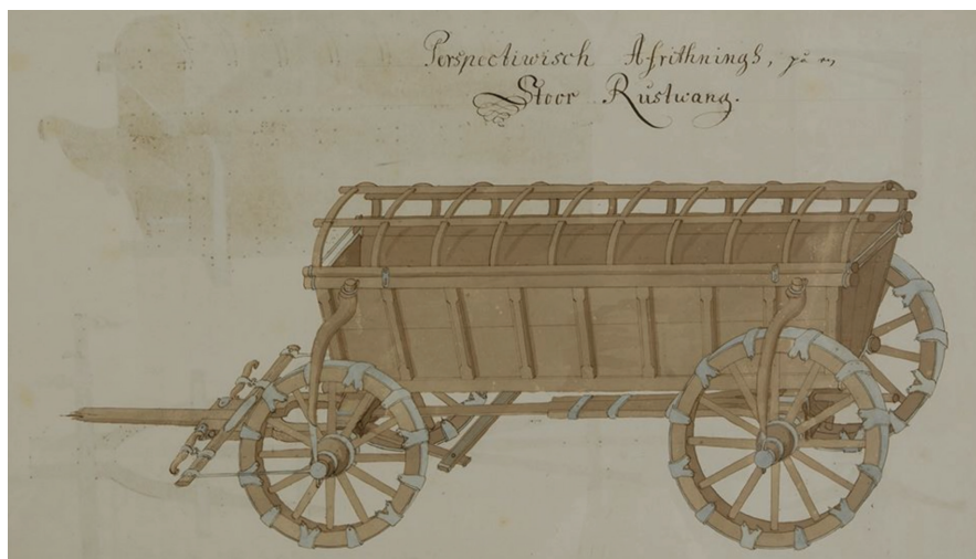
Rustvagn från 1700-talet.

Efter två års betänkande så presenterades ett förslag som i fred skulle försörja varje arméfördelning med var sin trängbataljon om två kompanier, sammanlagt sex trängbataljoner. I förslaget så nämns begrepp som operationsbas, förbindelser och man skissar på system för hur arbetet bakom fronten ska ske. Man kan nog påstå att det förslaget ända fram till mitten på 1900-talet är till delar grunden för den moderna underhållstjänsten.