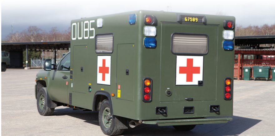
Ambulans förstärkte den civila sjukvården med sjuktransporter.

Ett stöd till samhällets pandemibekämpning i form av ambulanser och personal, som förstärkt den civila sjukvården med sjuktransporter och till del med transport av sjukvårdsmateriel, är något som varit mycket uppskattat. Våra anställda soldater har gjort ett enormt jobb och fått mycket erfarenhet av skarp verksamhet. De har uppträtt med pondus och en stark vilja att lösa uppgift. Soldaterna har varit fina ambassadörer för T 2 och Försvarsmakten. Även om det inneburit mycket jobb under dygnets alla timmar och under flertalet av våra stora högtider som jul, nyår och påsk, sker arbetet med stort engagemang och ett leende på läpparna. Vi har löst denna