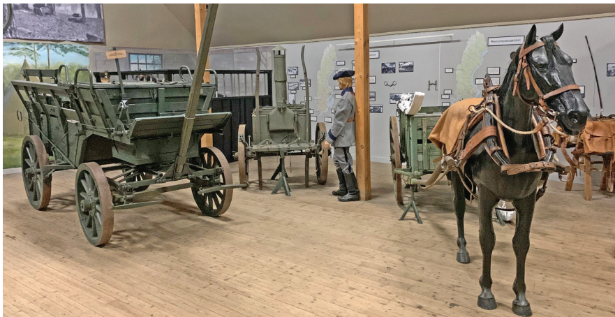
Interiör från Garnisonsmuseet.