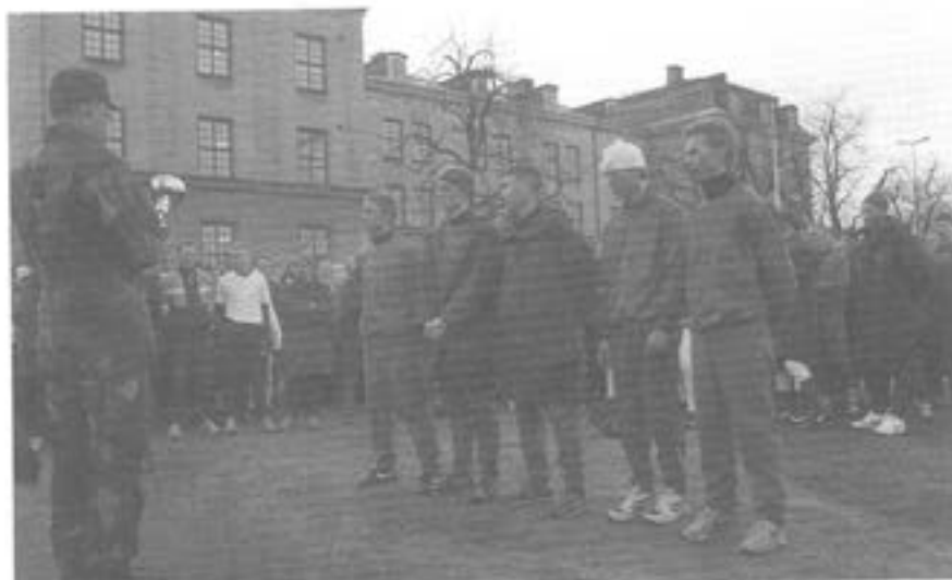
- Kårchefen beredd dela ut pris till vinnande lag. ( 3. komp )

Därutöver genomförde flera T 2-officerare Vasaloppet /öppet spår.