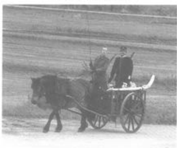
- Trosskärra m37