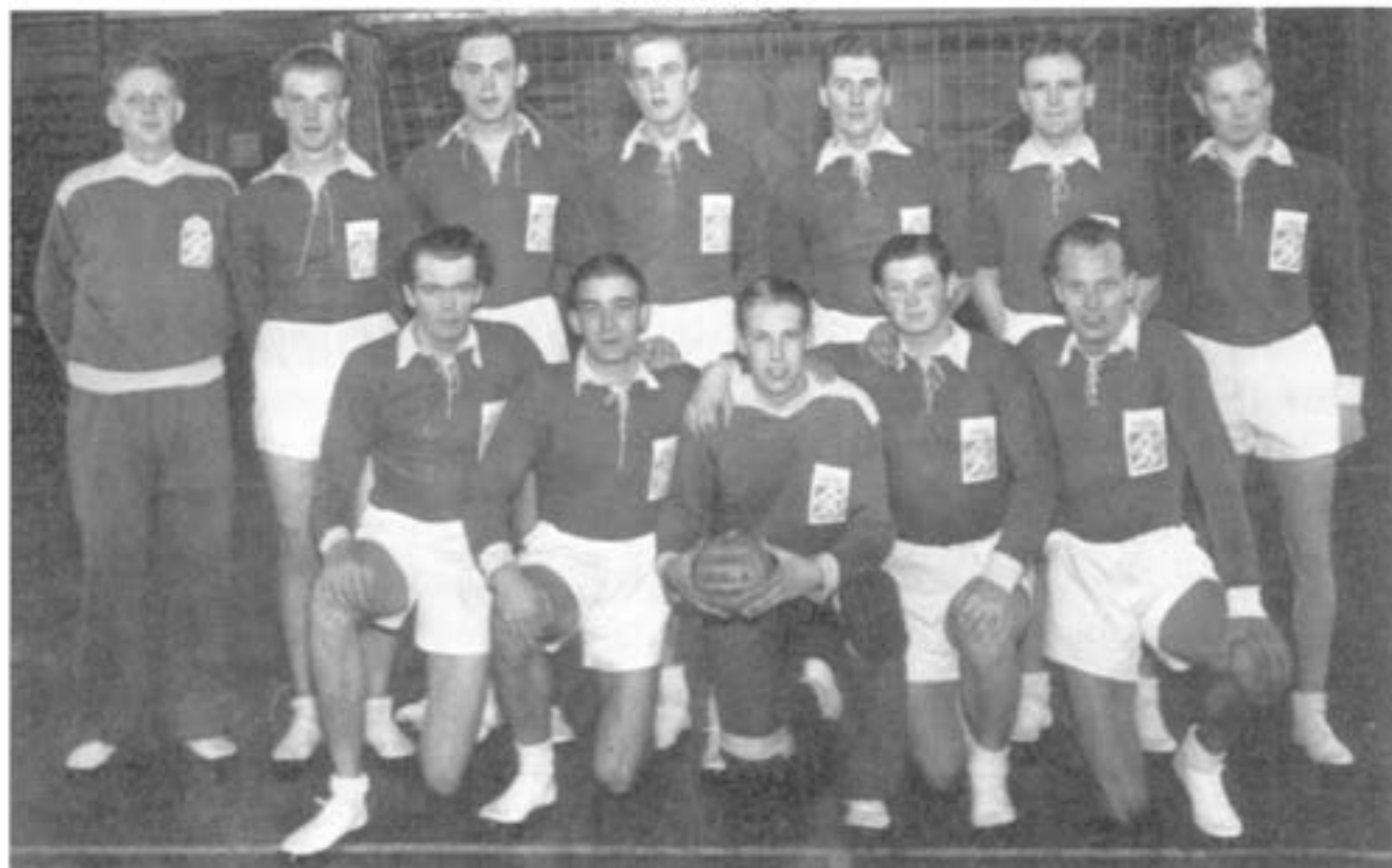
T2 handbollslag Milomästare 1945

Under 40- och 50- talen var handbollen starkt knuten till de militära förbanden, kanske främst på grund av brist på idrottshallar. Handboll spelades då i regementenas gymnastiksalar. Det främsta exemplet från denna tiden är kanske F 11:s allsvenska handbollslag vars lagmedlemmar utgjordes av flottiljanställda.