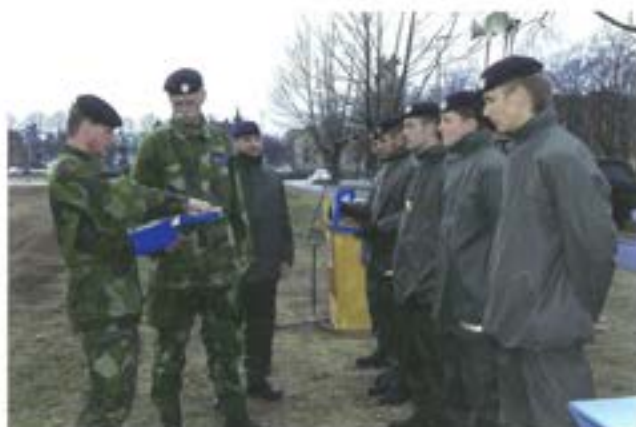
Utdelning av pris till "Bäste soldat"