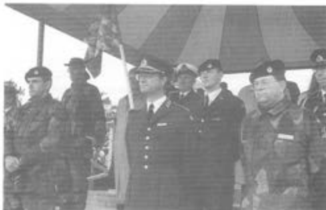
-Konung Carl XVI Gustav -intresserad åskådare ( flankerad av öv P Lundberg och B Andersson.)

I tidstrogna uniformer m m följde 6 hästeki-page, varav det första var T 2:s kungsvagn (byggd för T 2 1900 i Paris, utlånad av Niils Gyllensvan, hästarna från Ingvar Karlsson). På vagnen spelade Fältmusikanterna (1905 föregicks kåren av sin trumpetare till fots). Så kom en postdiligens m/1850, ursprungligen tilldelad Västmanlands trängkår i Sala (T 5). Den användes av regementspastor och regementsintendent vid fältjänstövningar (vagnen utlånad av Sala hembygdsförening, hästarna av Yngve Käll).