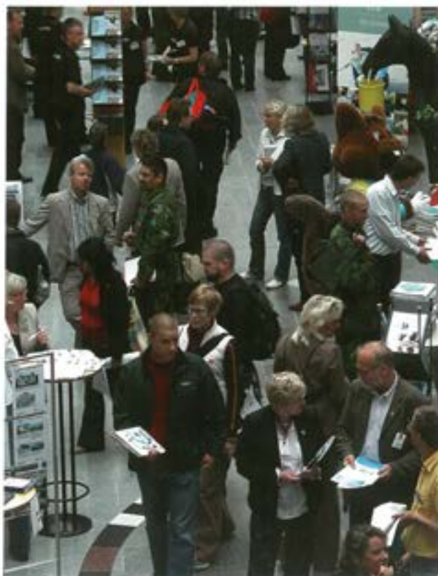
Besökarna fick bland annat information i Skövde Stadshus

Av de som var här på besök har 38 personer tackat ja till ny placering tillsvidare vid T2. Ytterligare tre bemanningsmöten kommer att äga rum under våren och sommaren. T2:s totala personalram skall öka med knappt 100 anställda.