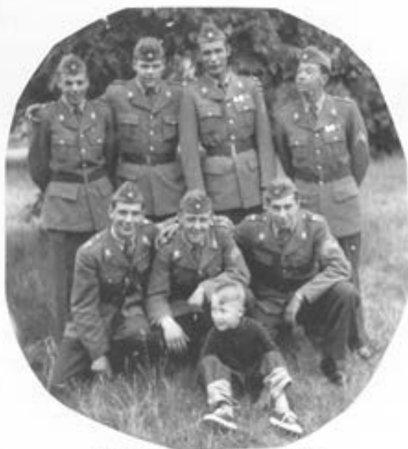
IS1 "Instruktörskola 1"

Det var således inte i halvtid jag gjorde mitt inhopp även om ytterligare 50 år förflutit med T2 i Skövde, det var förmodligen ett helt vanligt spelarbyte och än är inte matchen slut, även om vi som var med då får nöja oss med att sitta på läktaren och heja på.