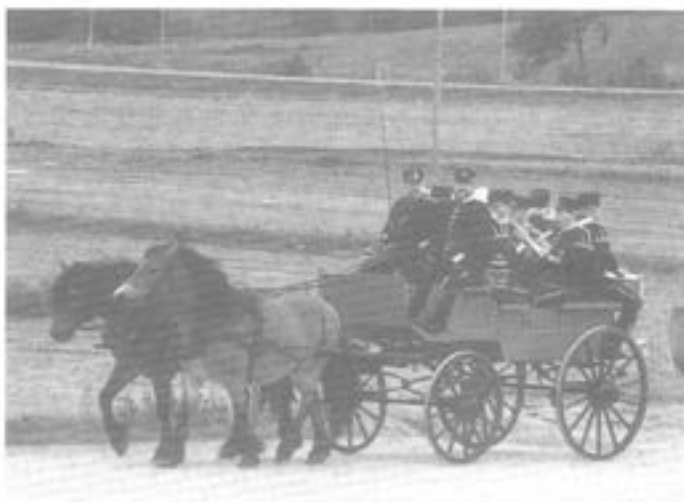
- T2 kungsvagn

Efter förbimarschen ställdes ekipagen upp så att de talrika åskådarna hade möjlighet att skärskåda dem och i många fall minnas flydda dagar. Där fanns dessutom förbandsplats m m samt Arméns fältbageri där man kunde få wienerbröd och kaffe. Senare på dagen fortsatte kortegen till Hertig Johans torg. Där fortsatte firandet även på lördagen, då många skövdebor njöt av fältbageriets wienerbröd samtidigt som de studerade den "vita bussen", en skärmställning m m som stadens livaktiga 90-åring presenterade.