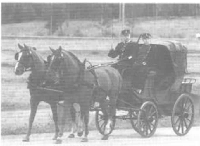
- Postdiligens m/1850