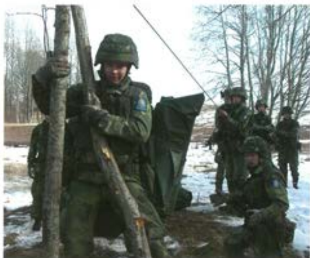
Arbete med "A-bro"

inbrott väntade ingen vila. Ovissheten rådde. Ständiga förflyttningar blev istället verklighet. Det blev ingen sömn under natten. Med ställda tidskrav krävdes ständig förflyttning = ständig fotmarsch.