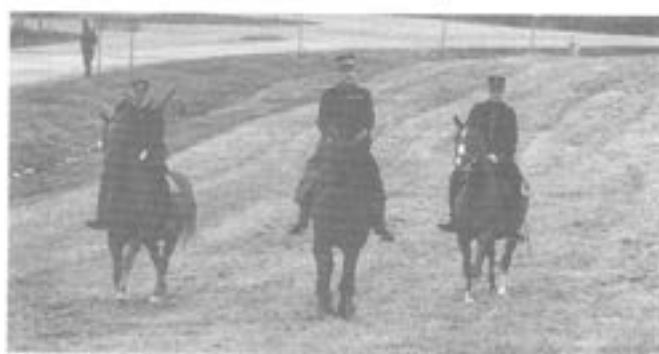
-Kårchefen med adjutant och ordonnans.