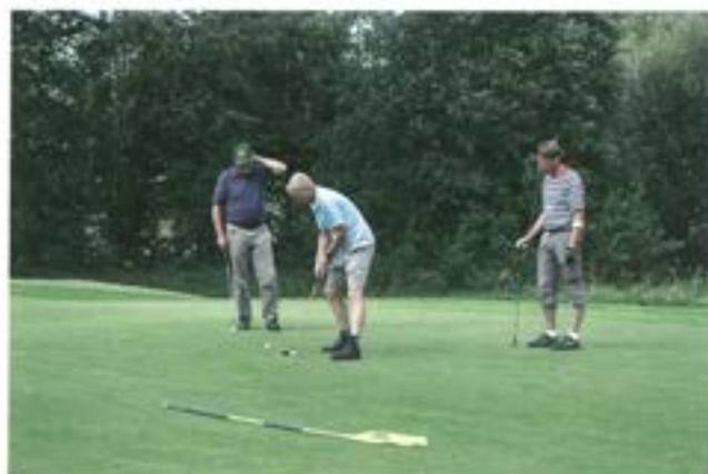
Tre "oldtimers" i koncentration på green