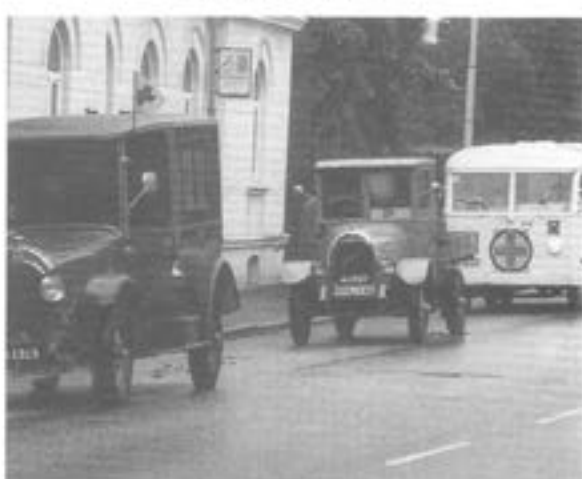
- Tre veteraner, fr.v: ambulans m/1919, lastbil m/1927 ("Tidaholmaren"), sjuktransportbuss m/41.