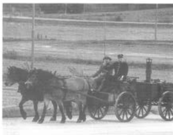
- Kokvagn m/1919