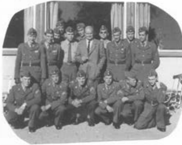
BSI "Befälsskola instruktörer" och BMS "Beställningsmannaskola, sjukvård"

"Vid sjutton års ålder blev stugan mig trång". Denna travesti av E. G. Geijers bevingade ord ägde sin tillämpning på mig när jag kände att arbetet som affärsbiträde i Assbecks anrika herrekipering i Skövde visserligen hade många fördelar men att det erbjöd alltför lite av utomhusvistelse och utvecklingsmöjligheter. Helst ville jag studera för att bygga på de åtta obligatoriska skolåren, men de ekonomiska förutsättningarna saknades. En av min mors väninnor tipsade mig om att jag kunde göra min värnplik i förväg och att försvaret erbjöd utbildning även i civila ämnen för den som ville bli yrkesbefäl, bl.a. kunde man få ta körkort.