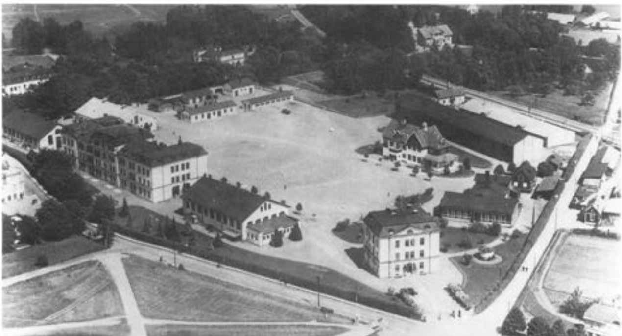
Kungl Göta trängkår 1935 ( längst t.v. " Garnis " )

Vi sörjer en uppskattad medarbetare och god kamrat.