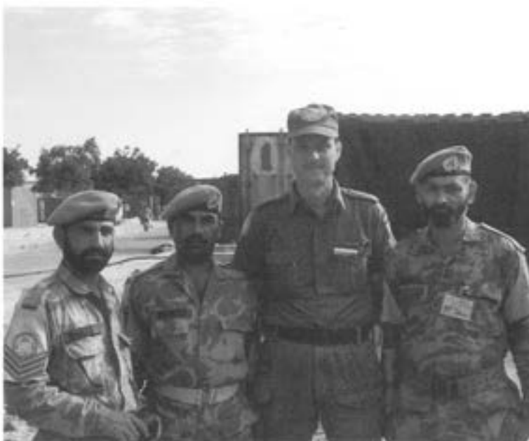
- Författaren bland pakistanska kollegor på sjukhusområdet i Mogadishu.

Resan påbörjades med flyg från Arlanda annandag jul -94 och ombord fanns jag och fyra andra officerare, som alla varit verksamma vid något av de fyra sjukhus, som Sverige bemannat i Mogadishu under 1993. Resan och landningen i Nairobi var helt odramatisk och vi såg fram emot att få återkomma till universitetsområdet i Mogadishu, där sjukhuset sedan ett år tillbaka bemannats av en Pakistansk styrka. Det var denna vi förväntades hjälpa med att plocka ned och packa ihop sjukhusmaterielen, som snarast därefter skulle sändas iväg med båt till något lugnare ställe. Den Pakistanska styrkan hade begärt svenskt bistånd, då de inte trodde sig om att kunna genomföra nedmonteringen av den tidigare svenska, men nu FN-ägda sjukhusmaterielen på egen hand.