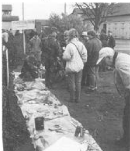
- Överlevnadskunskap förmedlas.