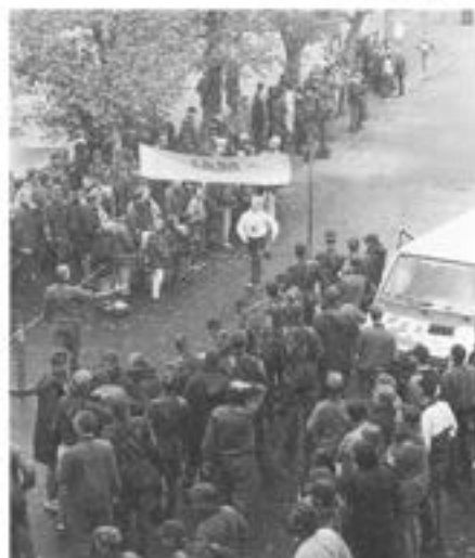
- Målgång i stafetten.