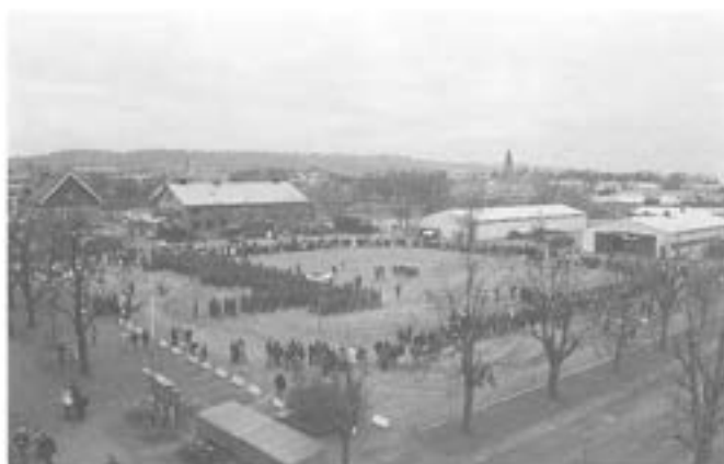
- Fanvakten och kamratföreningens fanor.