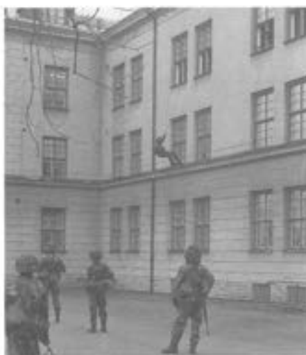
- "Bonnpermis" ?