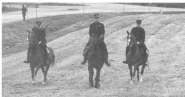
-Kårchefen med adjutant och ordonnans.