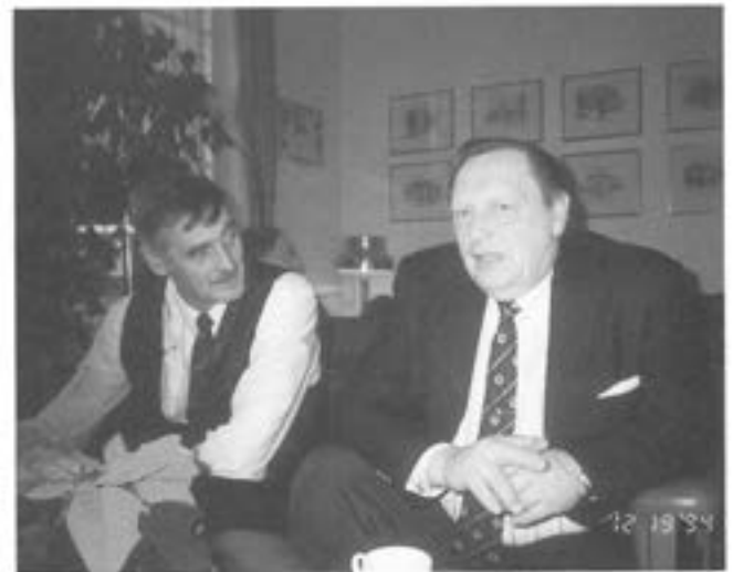
- "Lejonkungen" och "Valle": Motorer eller lantbruk?