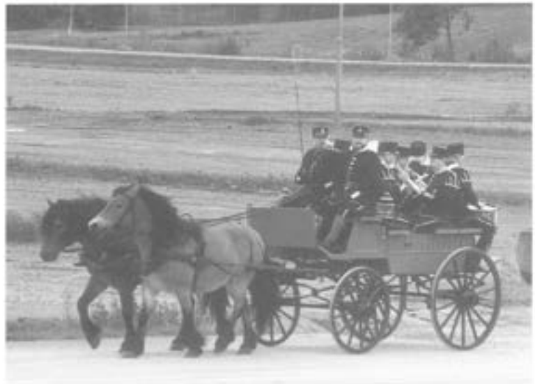
- T2 kungsvagn

Efter förbimarschen ställdes ekipagen upp så att de talrika åskådarna hade möjlighet att skärskåda dem och i många fall minnas flydda dagar. Där fanns dessutom förbandsplats m m samt Arméns fältbageri där man kunde få wienerbröd och kaffe. Senare på dagen fortsatte kortegen till Hertig Johans torg. Där fortsatte firandet även på lördagen, då många skövdebor njöt av fältbageriets wienerbröd samtidigt som de studerade den "vita bussen", en skärmställning m m som stadens livaktiga 90-åring presenterade.