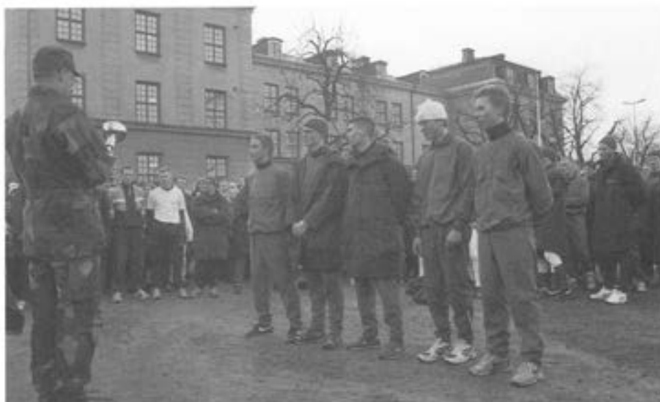
- Kårchefen beredd dela ut pris till vinnande lag. ( 3. komp )

Därutöver genomförde flera T 2-officerare Vasaloppet /öppet spår.