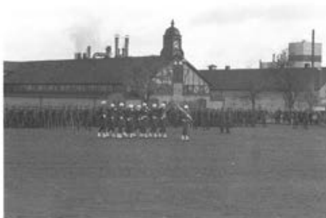
- Kåren uppställd med fanvakt.