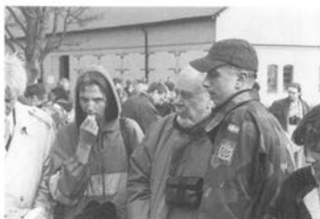
-Fam Tausis avsmakar naturens nödproviant.