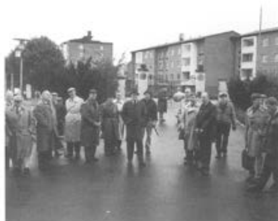
- Åter inom grindarna