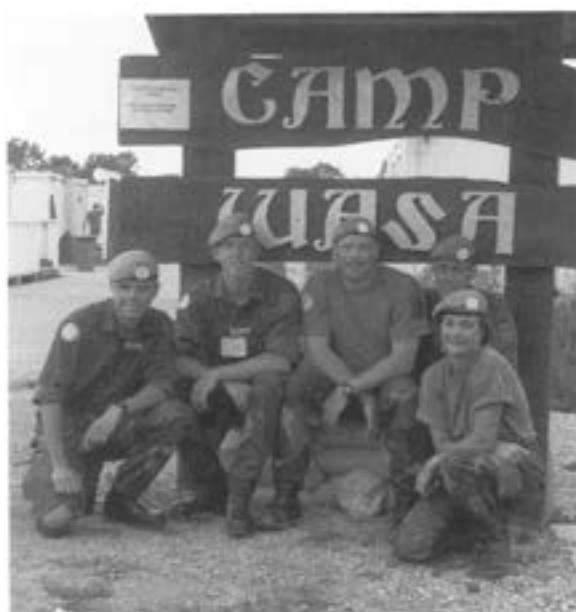
- Författaren (t.h.) med några skaraborgare.

Fram till våren 1995 hade UNPROFOR fortfarande dessa uppgifter, men efter hand som konflikten trappades upp i Kroatien, med Kroatiska offensiver mot framför allt Krajina området i augusti 1995, har UNPROFORs roll och situation ändrats. Detta kommer jag inte gå närmare in på här, utan fortsätta med att berätta om vad vi svenskar gjorde där.