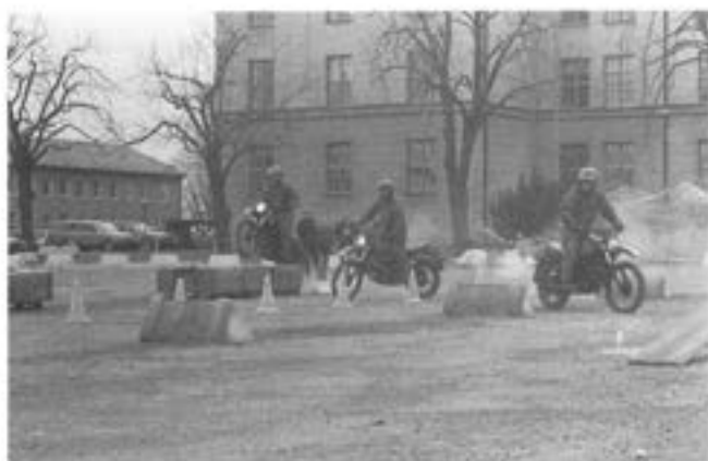
- Blivande armélejon ?