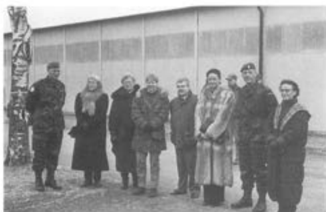
- Dansk - svensk blandning.