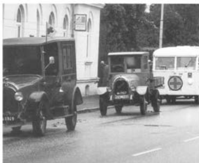
- Tre veteraner, fr.v: ambulans m/1919, lastbil m/1927 ("Tidaholmaren"), sjuktransportbuss m/41.