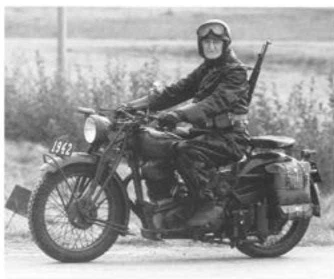
- "Gamle Albin - den bäste här i världen-----".