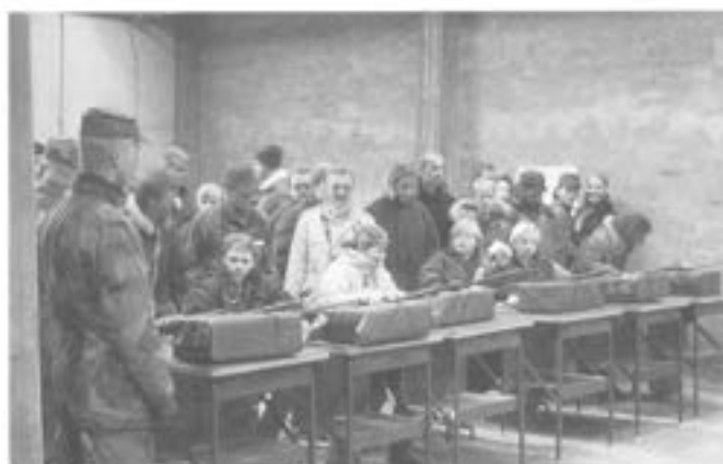
- Luftgevär, ett populärt inslag.