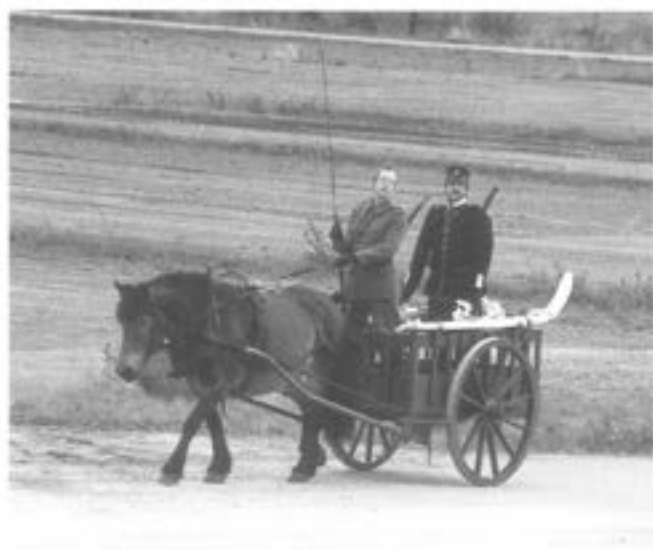
- Trosskärra m37