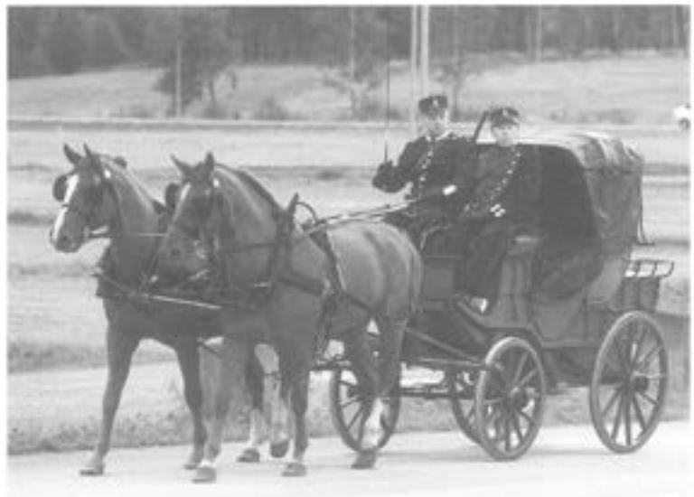
- Postdiligens m/1850