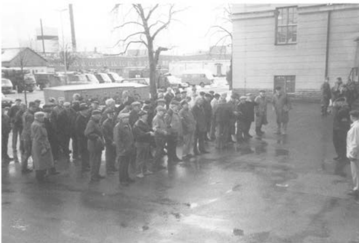
- K-E Dahl längst till höger framför 4. plut där man också ser dåvarande fanj E. Lindberg

Alla var överens om att det varit en alltigenom lyckad dag och kände stor tacksamhet till herrarna Dahl och Svensson. En ny sammankomst planerades att äga rum om några år.