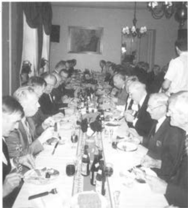
- Redan vid julbordet är berättandet i full gång

Man önskar att fler av de yngre Götaträngarna toge vara på denna ypperliga möjlighet att uppleva några givande timmar då icke blott god mat och dryck serveras utan även en rikedom av erfarenheter samt bra historier och anekdoter (varav dock ett fåtal bör fortleva endast i den muntliga traditionen, d v s de är mer eller mindre otryckbara). Yngre Götaträngare ni är välkomna att föra "stafetten" vidare