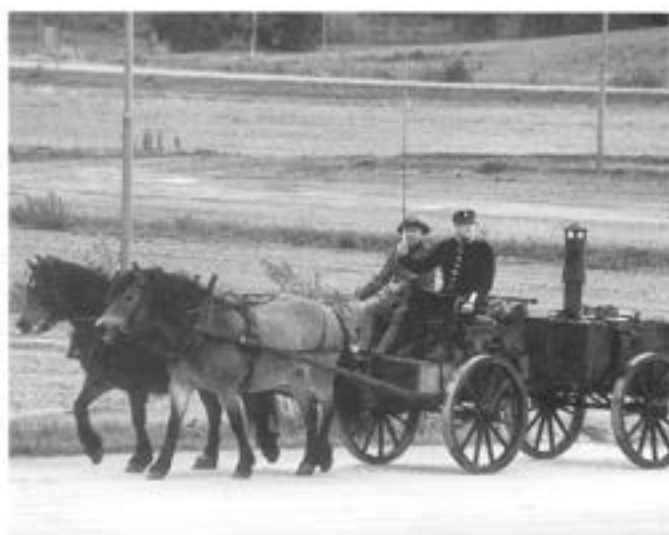
- Kokvagn m/1919