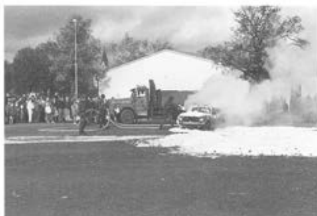
- ISB-plutonen visar brandbekämpning.