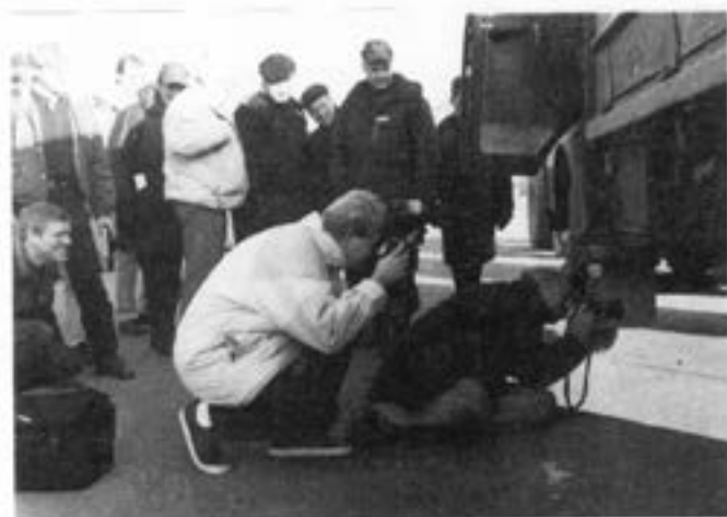
En doft av pop-corn spreds från avgasröret

Vi på lokal nivå hoppas nu att försöken med miljövänligt drivmedel fortsätter och utökas. Det var så härligt då det spreds en doft av Pop-corn från vår transportpluton.