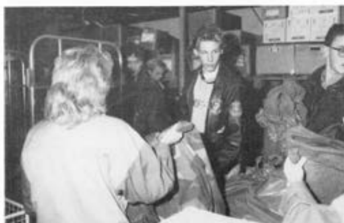
Muckarglädje? - Knappast

Kompaniet genomförde såväl en 7 dagars slutövning som en samövning med US ROK med gott resultat efter Björck's beslut.