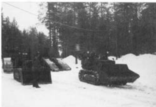
Lastning vid ett av mobförråden

Lastningen vid alla motorförråden fungerade över förväntan. Mycket för att de flesta förråden var förberedda enligt Zettersten's direktiv.