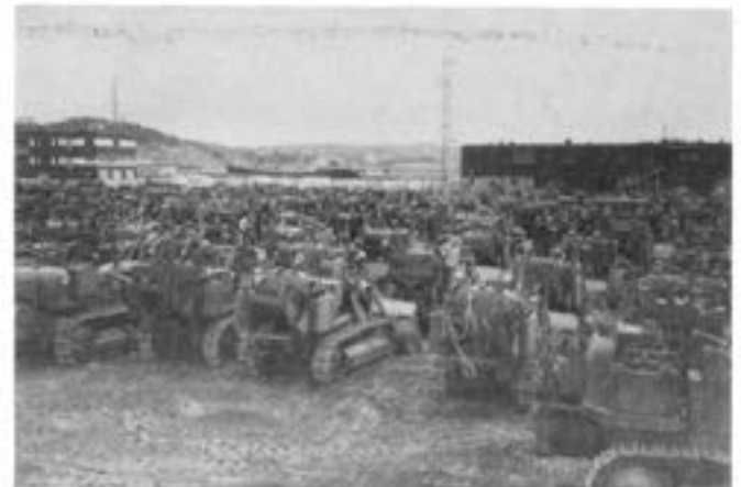
En anseelig mängd bandlastare samlades i utskepningshamnen i Uddevalla

Vissa soldater påstod sig drömma om bandlastare och hoppades att det nu skulle gå över.