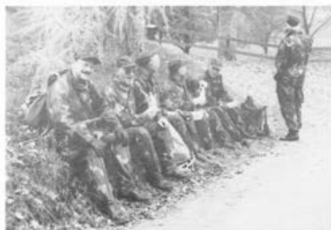
En välbehövlig "kort rast..." på en blåsig plats

Vid ett soldatprov behöver man inte lägga rastplatsen på det absolut blåsigaste stället.