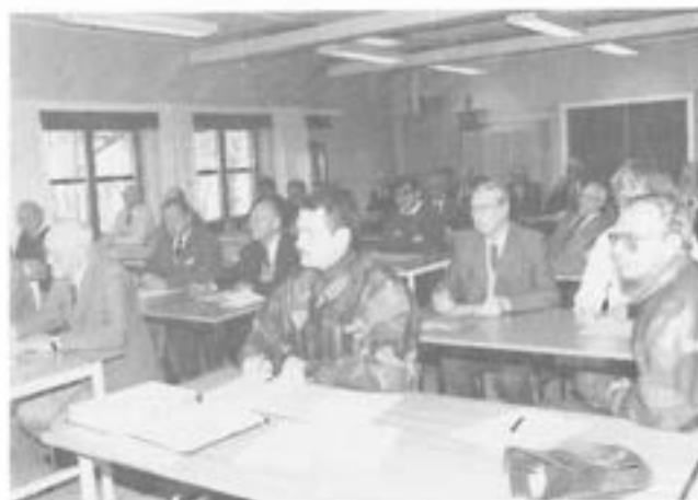
Möteslokalen var välfylld

Lördagen 9 november genomfördes traditionsenligt årsmöte för Kamratföreningen i samband med firandet av Regementets Dag.