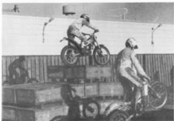
Ammunitionstjänst i en något annor- lunda form.....