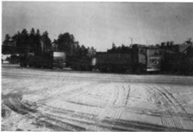
Lastning vid en av myndigheterna