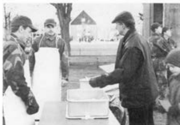
Major Otto von Krusenstierna låter sig väl smaka av intendenturplutonens goda?? smakbitar