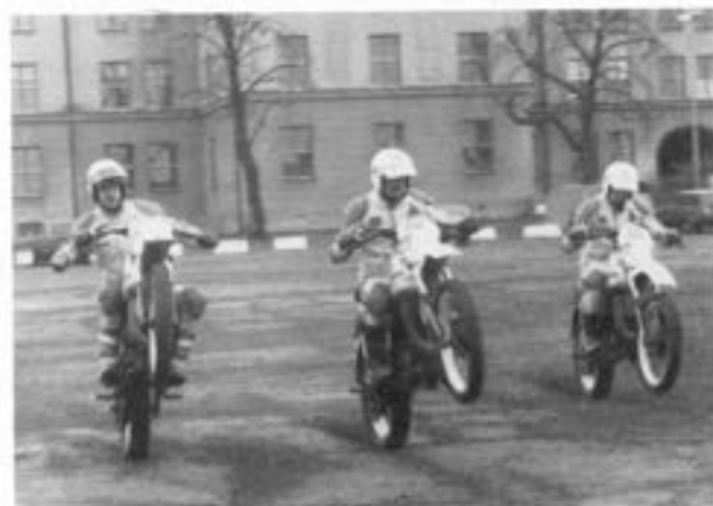
Fullt pådrag inför det avslutande "uppstället"

Showen avslutades med ett snyggt "uppställ" framför publiken och aktörerna fick varma och välförtjänta applåder.