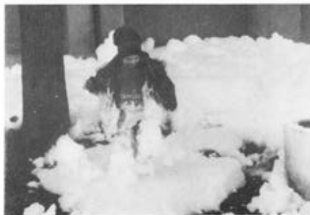
Det, av ISB-plutonen, utlagda brandskum- met blev en kul lekplats för de yngsta. Det var ju nästan den enda "snön" som kom detta utbildningsår