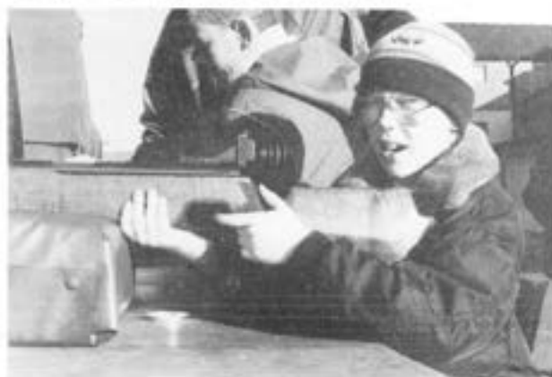
Och denne, som vi tyvärr ej har namnet på, var en god luftgevärsskytt