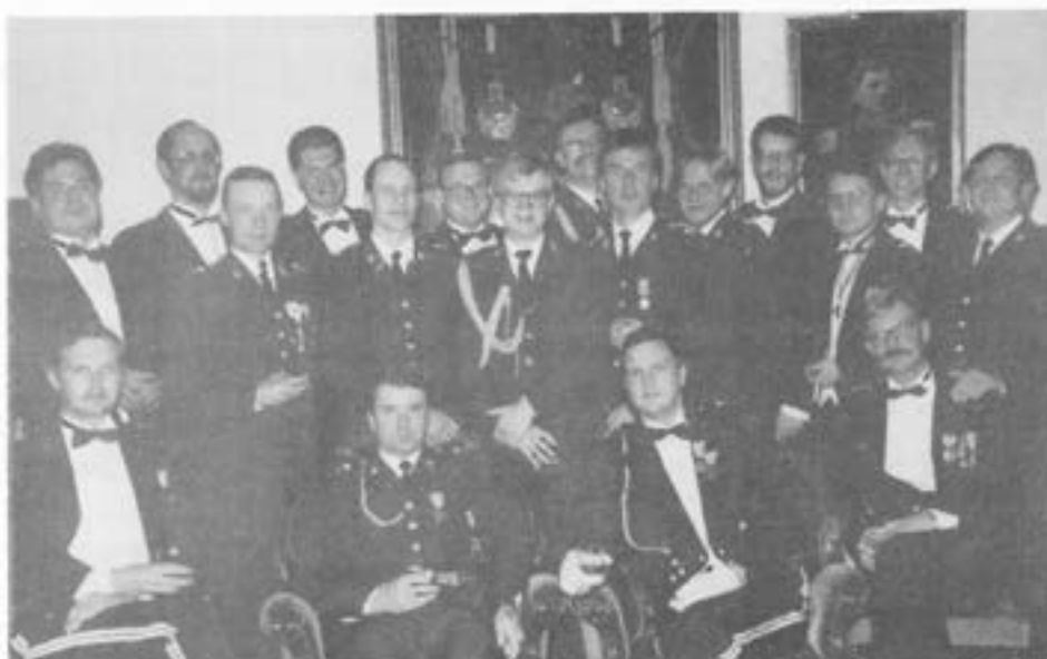
S.k "tjusiga officerstyper"

Kraakcorpset återsamlat till fest 22. november 1991