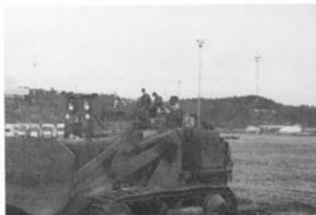
Löjtnant Sandberg på en av de s k "grodorna"

Det hela utvecklade sig till något liknande radiobilsåkning. Fem "grodor" for runt motorförrådet och gjorde centrumsvängar till allas förtjusning. Tyvärr delade inte chefen motorförrådet den.