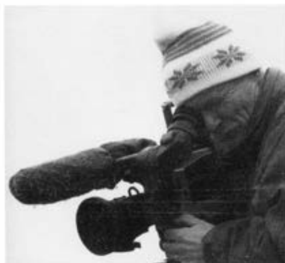
"Cron-video" från Garnisonsmedia

I samband med jubileumsåret inspelades en video som täcker hela jubiléet och alla evenemang på olika platser.