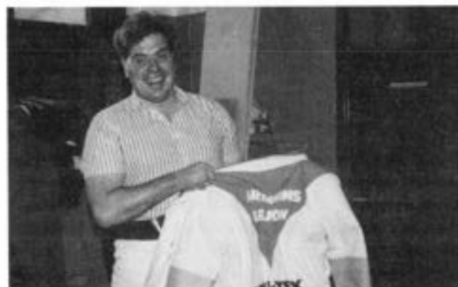
Hassel's Mc-ställ hade "krympt"...

De "gamla" lejonen började genast prova sina f d mc-kläder, stövlar, hjälmar m m. - En del kläder hade krympt märkbart.....eller var det kanske vissa lejon som vuxit....?