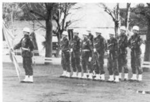
Fanvakten med kn Leif Ahfeldt som 1:e fanförlare