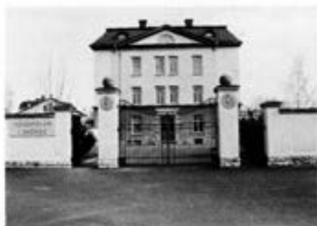
Gamla T 2 behåller sin "Högskolestatus"