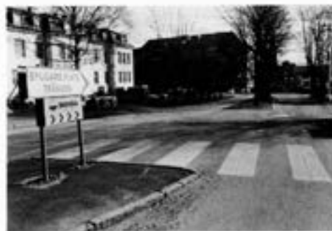
Visst ser det konstigt ut från vakten

Några av Er är säkert intresserade av hur det nu ser ut på "gamla T 2".