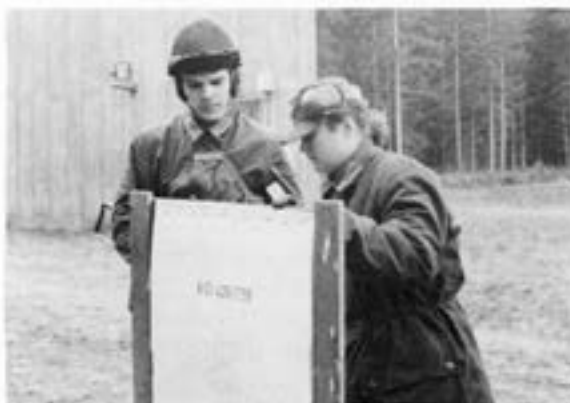
Två "snäpp" åt vänster.....?