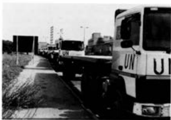
Tpkomp i väntläge inför lastning av containers i HAIFA hamn

Ett projekt som startades i juli innebar att FN chartrade en båt som går mellan Cypern, där FN köper in en hel del, t ex mat och cement, och Tyre där varorna - i containers - hämtas av tpkomp.