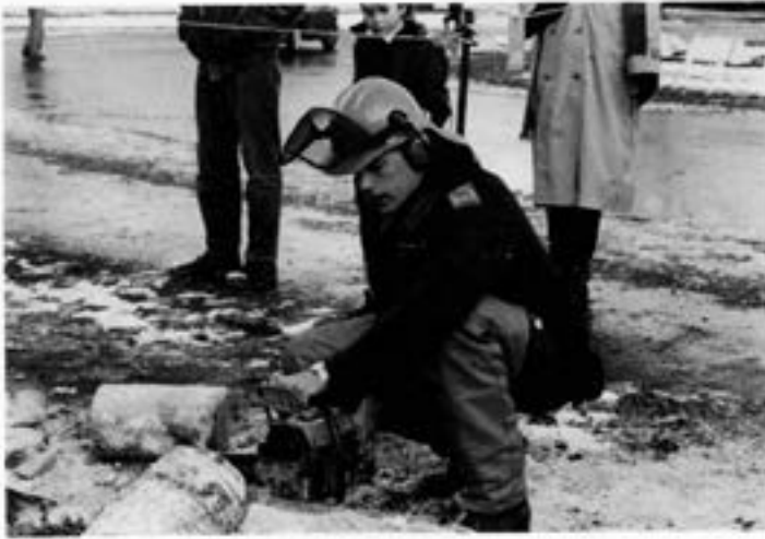
Pionjärerna demonstrerade såväl större som mindre arbetsmaskiner och redskap. Vid motorsågen Torssander från Vingåker