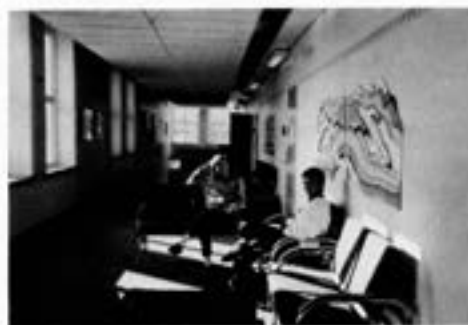
Korridoren har ändrat utseende - och även de som finns i den