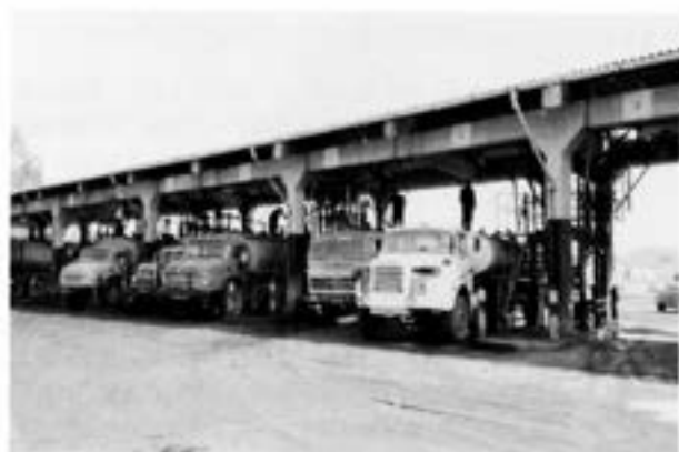
Drivmersättning i Zaharani

Det är bara att hoppas att det finns villiga och att befälsläget medger att de kan släppas ett tag från sina ordinarie arbetsuppgifter.