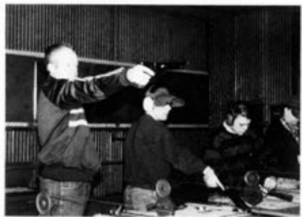
Amerikaresenären i aktion

lor, tvätterier, militärpolis, sopstation, brandkår m m. Frisören var jag tvungen att gå in till, med allt håret, och ut utan. Allt detta skall försörja cirka 35000 bofasta och cirka 35000 soldater årligen. 197:e Infanteribrigaden är stationerad här.