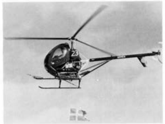
Arméns Vingar utför "materieltransport" åt Arméns Lejon