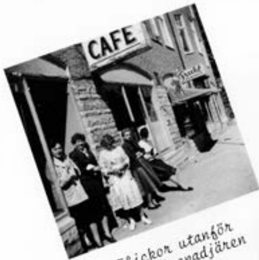
Flickor utanför café Grenadjären