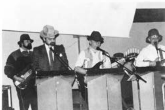
Stommen i julspelegänget

Efter "Julspexet" samlas man till julsupé.