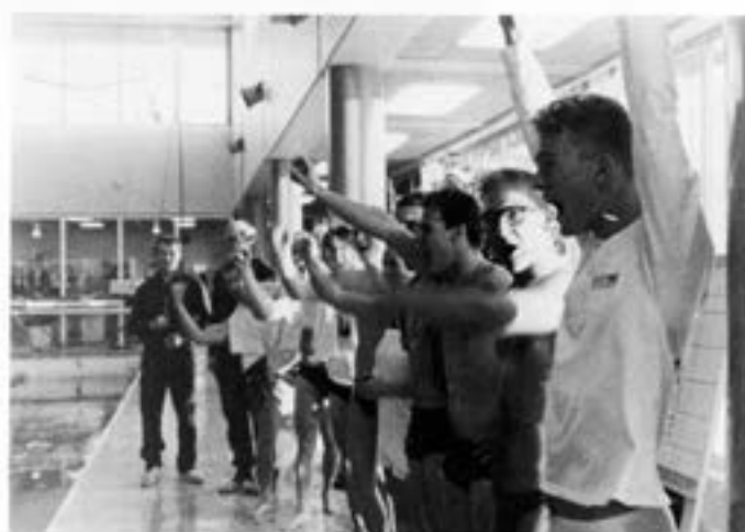
Segervrälet från laget ur 8. kompaniet

Där vann 8. kompaniet före 1., 3. och 7. kompaniet