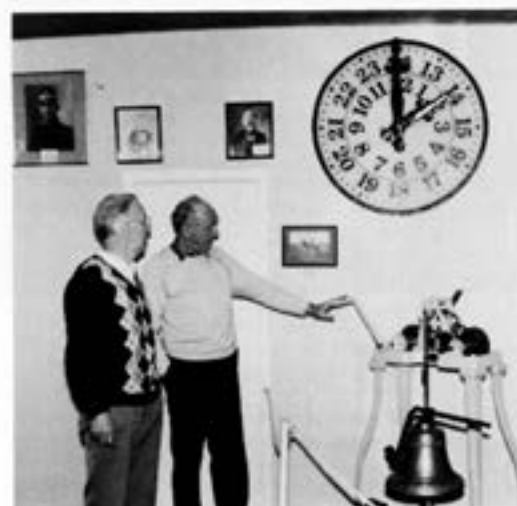
Den gamla stallklockan

På en mängd fotografier kan besökaren vidare återfinna personer och situationer från tidigt 1900-tal och fram till seklets mitt.