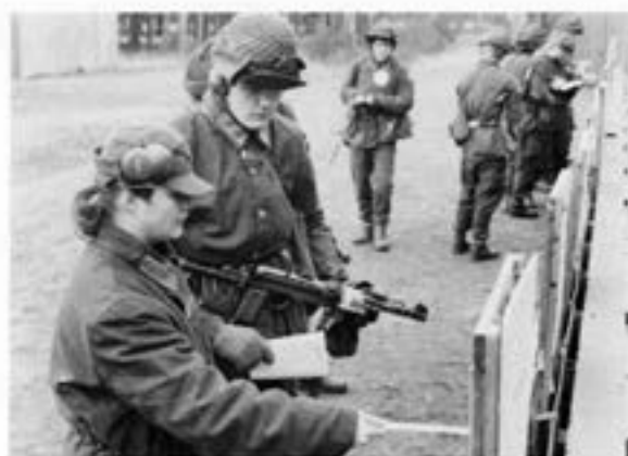
Skjutledare vid "PEK"

Sedan har vi det där med fältlivet, nej vi har inte eget tält eller husvagn som vissa tycks tro utan vi förläggs precis som alla andra plu-