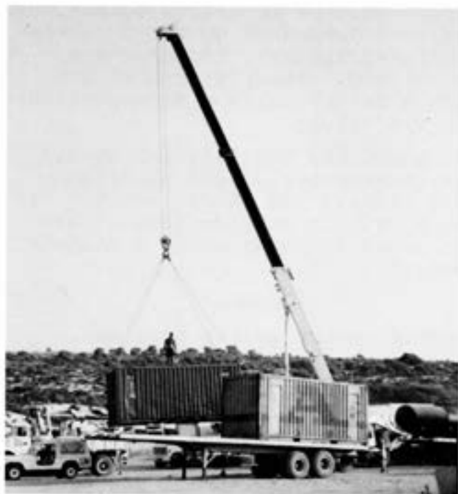
Kranarbete på campen

Normalläget var att två av de fyra kranarna, 4-5 av de 11 dragbilarna och 6-8 av de 30 lastbilarna stod stilla på grund av service och reparation.