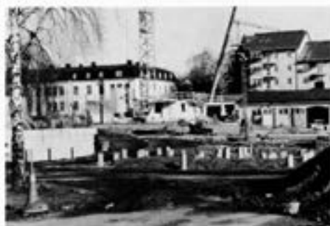
Nog borde väl marken här vara stampad så att pålning ej skulle vara behövlig