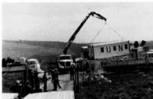
Tpkomp under demontering av op Chateau

Genom stora insatser från såväl reparationspersonal som förare lyckades det hela dock hållas flytande men alltsom oftast fick transportuppdrag skjutas upp på grund av brist på fordon.