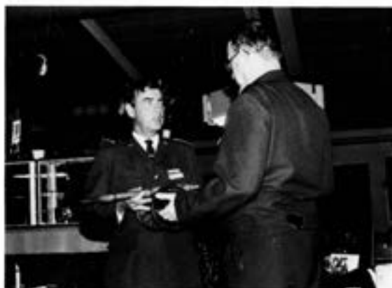
Chefen T 2 mottager vpr i skytte