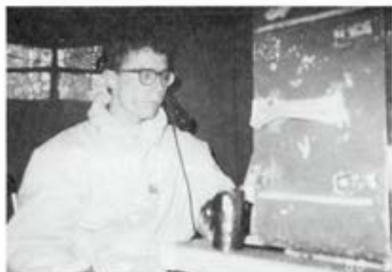
..... ständig passning i sambandscentralen