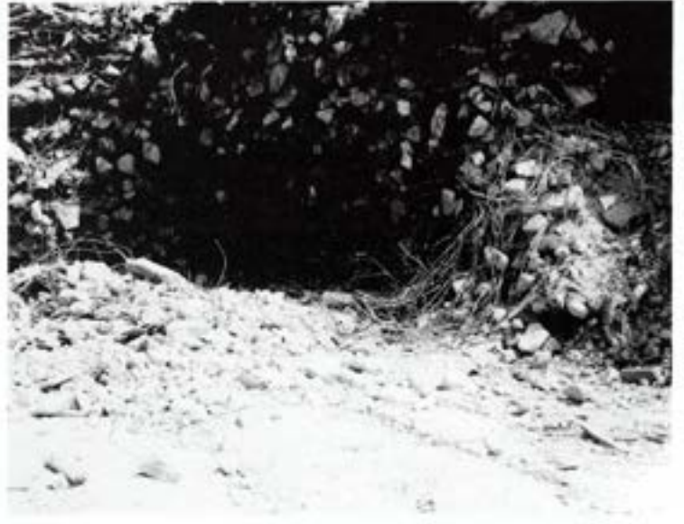
Katastrofen är ett faktum

het genom att ta sig ut via trapphuset och ingången. De borde alltså hunnit till trapphuset innan huset föll samman.