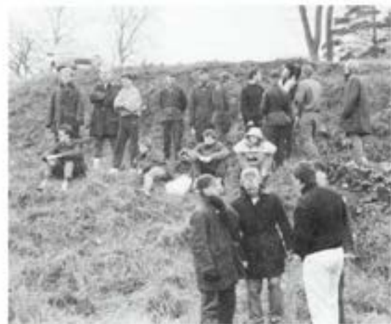
Totalbild av publikhavet!

Kompanimästare i lagkapp-simning blev 1. komp och de som stod för den bedriften var: