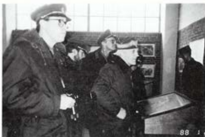
Besök i Regimentets museum