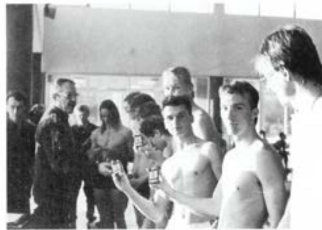
Regementschefen förrättar prisutdelning

Tävlingarna gick av stapeln i ett så gott som fullsatt Skövde Badhus. Inte kan väl idrottsavd kommentar: "Publik blir det bara tävlingarna går inomhus" kanske ha relevans när man jämför med terränglöpning