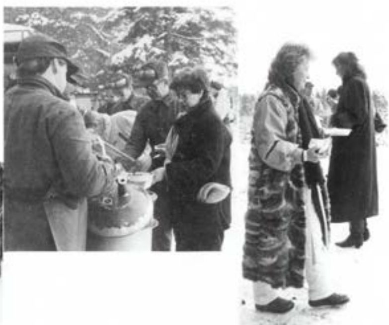
Delar av Regementsstaben på studiebesök