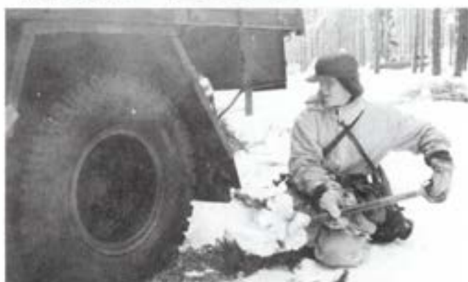
Vissa problem fanns att övervinna