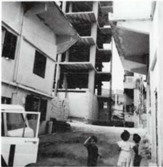
Dagen före katastrofen -----