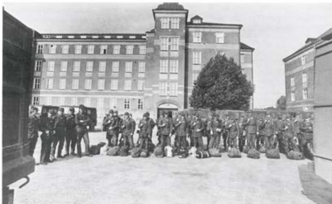
Rep/intkomp uppställt på P 4 kaserngård före intagandet av de nyrenoverade och trivsamma förläggningslokalerna

"Försten ut" i flyttningskarusellen var för T 2:s del rep/intkomp, självfallet eftersom del av detta kompani har flyttningsvana. Repdelen kom ju på 40-talet till T 2, förlades på III. bat:s 4. vån på P 4, flyttades sedan till P 4 barackläger innan det förlades till T 2 och nu ingår i det nyorganiserade rep/intkomp vilket sommaren