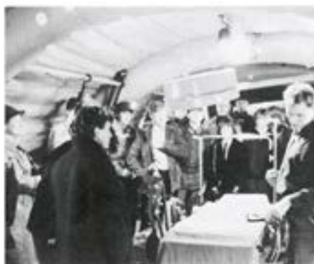
Intresserade åhörare till redogörelse för utrustningen i vårt eget "M*A*S*H"