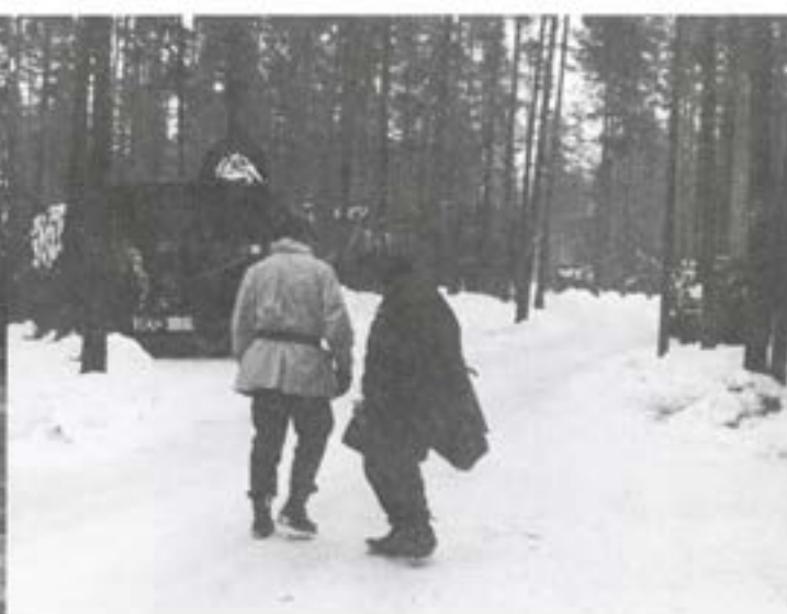
Transportkompaniets grupperingsplats norr Busjön