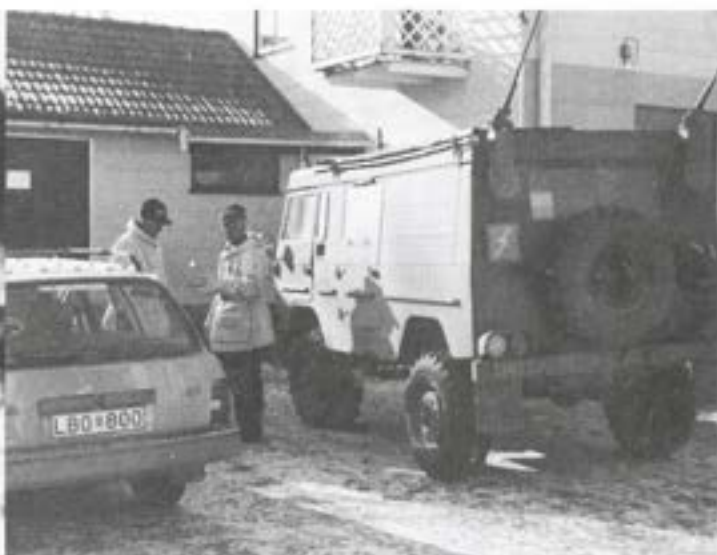
Övlt L O Nordmark och mj L-G Winterfeldt vid sambands- och upplysningsplatsen i Opsaheden