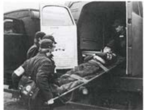
Lastning av skadad i sjuktransportbil