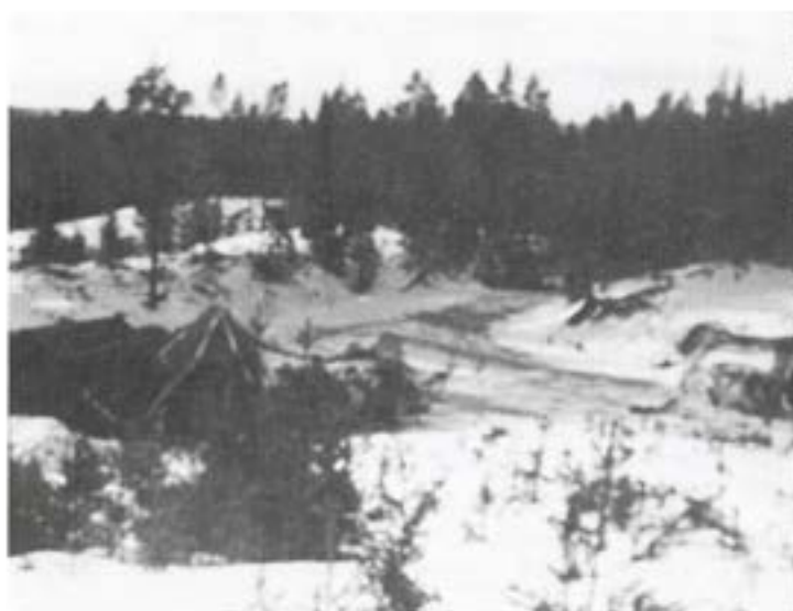
Reparationspluton i grus-taget