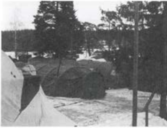
Del av brigadförbandsplatsen i Vansbro