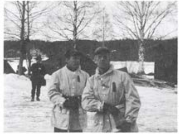
Arméchefen på besök

Måndagen den 28. februari rullade bataljonen de 28 milen till övningsområdet. Marschen gick bra med endast ett tillbud. Motorhuven på rep-intkompaniets packbil, en NB 88 flög upp och slog ut vindrutan strax söder Kristinehamn.