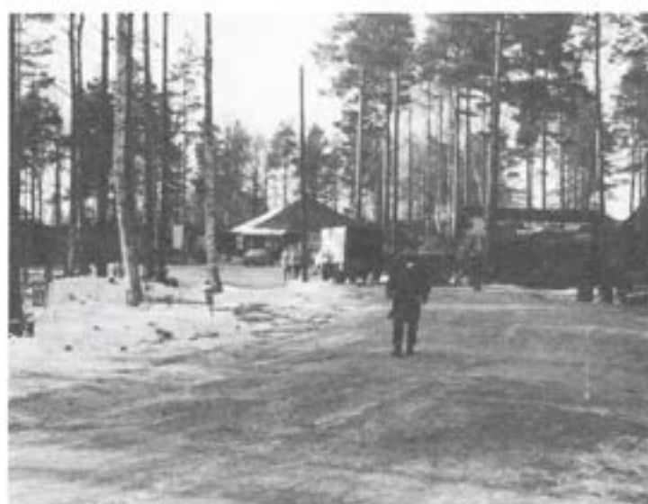
Intendenturplutonens grupperingsplats med dansbanan i bakgrunden