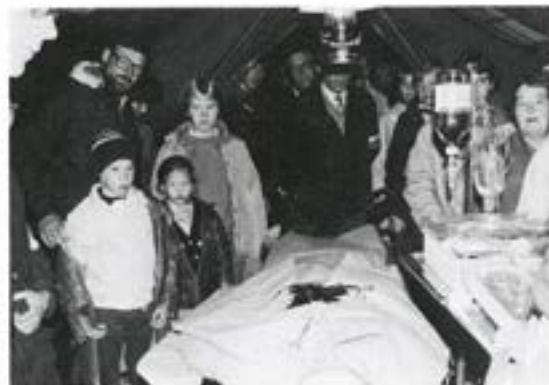
"Är det manne på riktigt tro?"