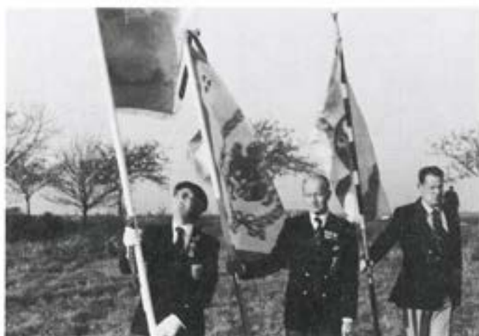
Fanor och standar Fr v. Smålands Husarers standar, i mitten Örebrogrenadjärernas fana och t h. Hallands (f d Vestgöta-Dals) fana

På morgonen den 6. nov, låter det inte som skoltidens historiebok, purrades vi i bästa militär stil tidigt och utspisades varefter det bar av mot Lützen för att vi redan vid 8-tiden skulle kunna stå på slagfältet och formeras så gott vår styrka tillät. Man fick vara glad för att vi ej behövde masa oss upp ännu tidigare. Det sägs ju att slaget på sin tid började redan vid 4-tiden i den tidiga morgonen. Nu steg solen upp och lyste på de frostvita fälten och efteråt sade vi oss att vi gamla soldater måste på sin tid ha varit ett härdigt släkte eftersom vi inte ens nu där vi stod i kostymer och utan överrockar inte stupade i lunginflammation. Fanor och standar blottades och fladdrade i morgonvinden som inte alls medgav den berömda Lützen-dimman. Standaret, ja, det var givetvis Smålandshusarernas gula med det upprättstående röda Smålandslejonet som i sina klor håller ett armborst.