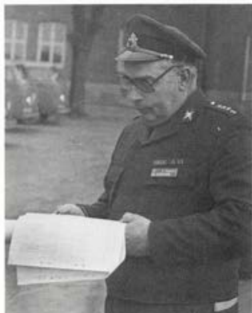
Noggrann kontroll av den detaljerade marschordern var nödvändig

Det internationella handikappåret 1981 har erhållit stöd och förstärkelse på många olika sätt. Inom Skaraborgs län kom detta bl a till uttryck i den "utrymningsövning" som T 2 genomförde söndagen den 10. maj. Bakgrunden var att HCK i Skaraborg och Röda Korset tillsammans gick ut till länets handikapporganisationer och frågade om intresse förelåg att delta i den demonstration som skulle avsluta det veckolånga handikappforum som arrangerats i Göteborg. Om intresse förelåg! Över 600 ja-svar!