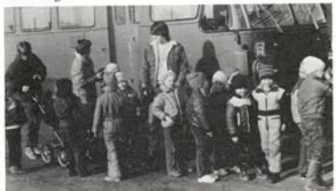
Fyllda av förväntan har Karlstorps dagis-barn just anlänt

Besöket avslutades med rundvandring bland motorområdet fordon innan "Hacke Hackspett-film" satte punkt för en uppskattad förmiddag.