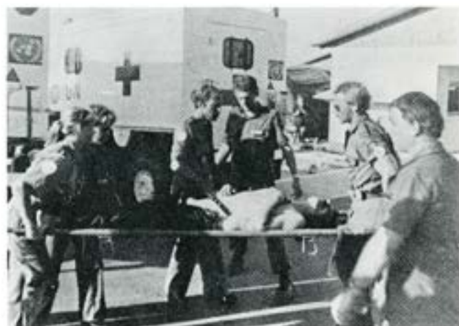
En skottskadad förs snabbt in för behandling

Jag rekommenderar denna berikande arbetsform när känslan för att göra något utöver det vanliga infinner sig.