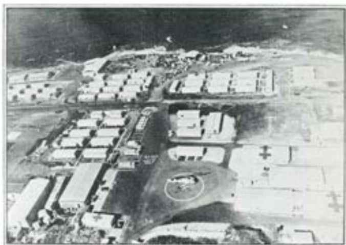
Flygbild över sjukhusanläggningen med helikopterlandningsplatsen i förgrunden och Medelhavet i bakgrunden

Sjukhuset har hög standard och hög kvalitet beroende på att det är enbart yrkesfolk som arbetar här. Vi har ett gott rykte bland de andra nationerna som uppskattar det arbete vi lägger ner. Samtidigt ger den oss rika möjligheter att lära känna andra folk, andra kulturer, andra levnadssätt. Inte minst lär man sig att vi är oerhört bortskämda hemma med den välfärdssjukvård vi har. Jag tror mig våga påstå att alla som tjänstgjort här har skaffat sig många erfarenheter och absolut inte önskar ha tiden här ogjord. Det är bara att önska att fler får möjligheten och det blir det ju med de två nya kompanier som ska sättas upp.