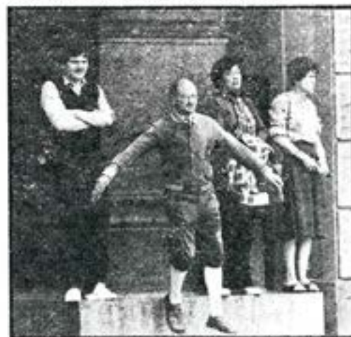
• Ett ovanligt sätt är att försöka flyga upp i luften för att få bättre utsikt...