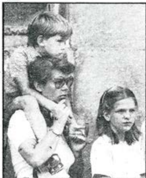
• Att sitta på mammans axlar är klassiskt.