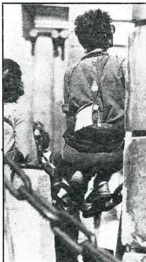
... andra utför avancerade balansnummer på kedjorna.