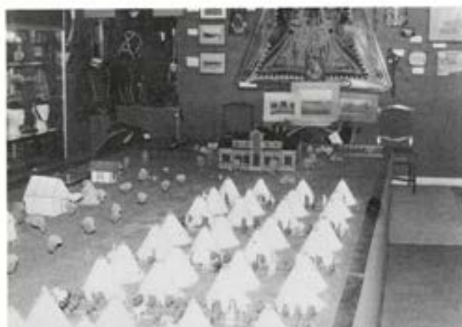
K 3 Museums vackra modell av Sannaheds lägerplats med officerspaviljongen i bakgrunden

Den är inte så impulsiv som den verkar första gången man hör den.