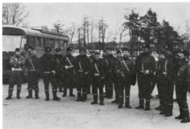
LTG i Borås lyssnar till dagens ordergivning

sationerna är intresserade av den motorutbildning som genomföres vid regementet. Sedan många år råder ett mycket gott samarbete mellan regementet och polis i utbildningshänseende. Varje åldersklass trafiksoldater får sin dirigeringsutbildning av instruktörer från läns trafikgruppen i Skövde, dessutom medverkar LTG mycket aktivt i det trafiksäkerhetsarbete som pågår under hela utbildningsåret. I gengäld ger regementet LTG möjlighet till repetitions- och vidareutbildning i besiktning och bibehållande av personlig färdighet i körning av tunga fordon.