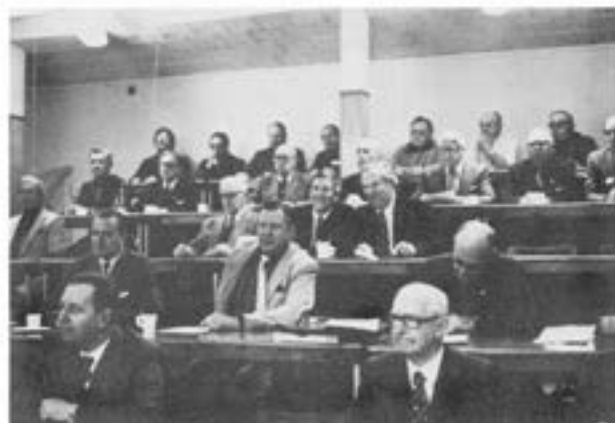
Ett välbesökt årsmöte lyssnar intresserat på stadgeändringsförslaget