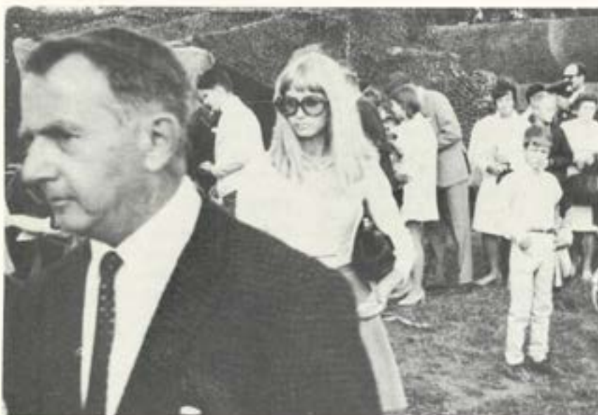
Anhöriga och vänner i alla åldrar fick både bröd och skådespel under regements dag.