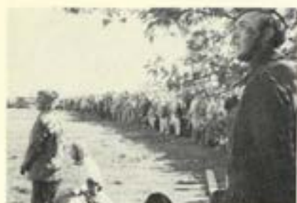
ÅskådARBILD från övningsfältet.