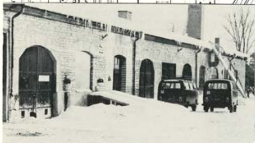
Gamla garaget vid Hjövågen — dags att pensioneras.