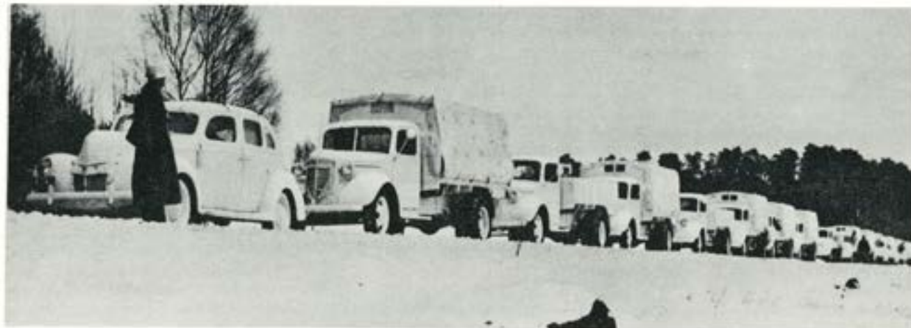
Den svenska frivilligkårens bilpark för sjukvårdstjänst och materieltransporter var av synnerligen hög klass.

Har man i årets budgetarbete månne beaktat detta beslut? Red. anm.