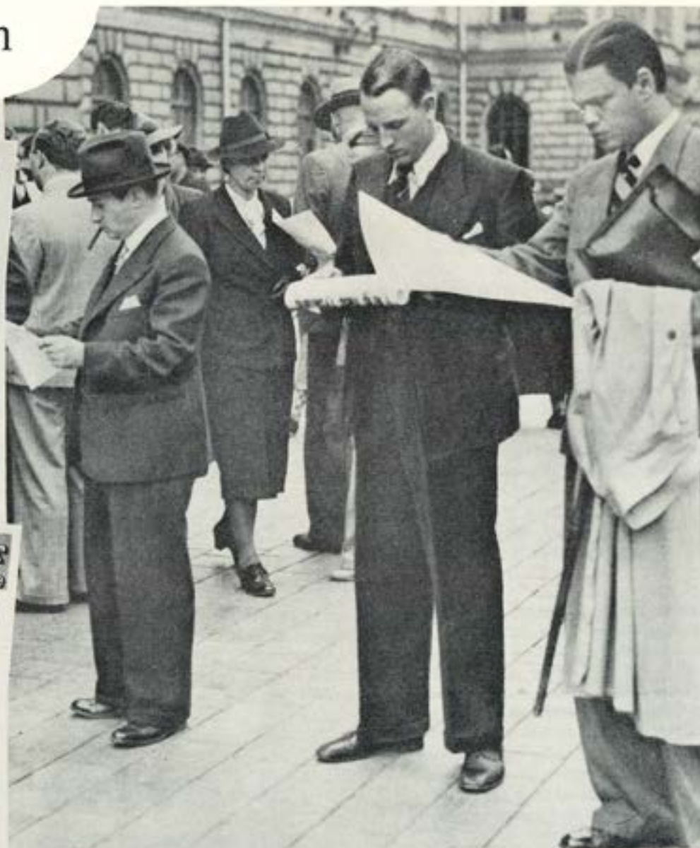
Löpsedlarna talade sitt tysta men fruktansvärda språk.

AFTONBLADET Extra 10 öre Uppl. 4 3 BOMB- ANFALL Hangö DÖDSOFFER på många orter ska antalsvägar | Finska regeringens ska sås tillbaka | Flyttar till VASA kräcktimmor KLINGENBERG ARNOLD av Åsa Lindh