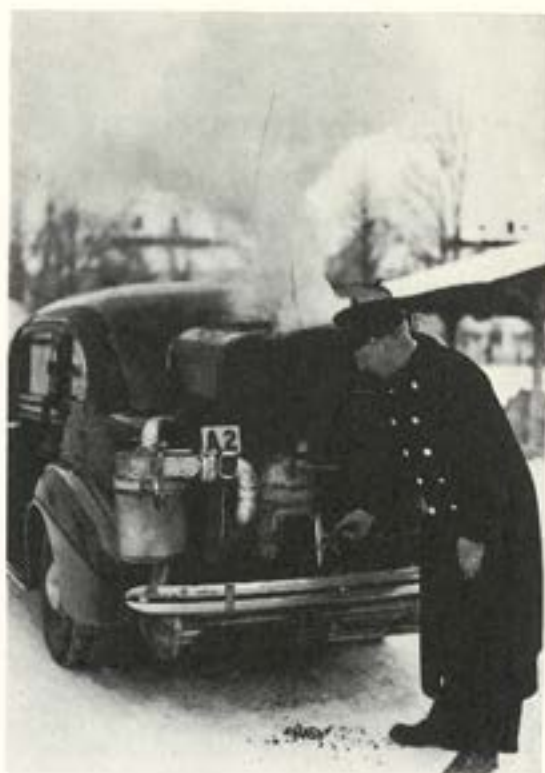
Från slott till koja var man beroende av gengasen under kriget. Här ser vi hur det bolmar friskt kring kungens gengasbil.