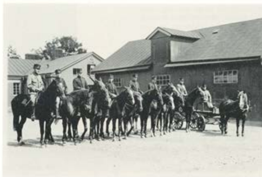
En svunnen tid