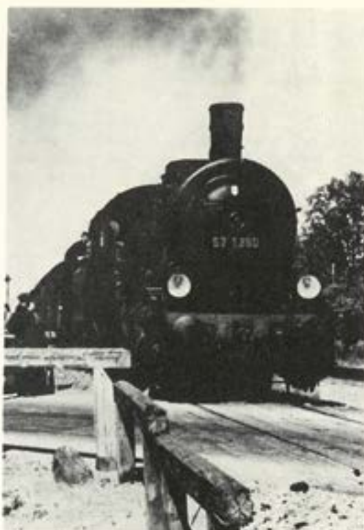
Statens Järnvägar håller en viss beredskapsreserv av ånglok.

Under beredskapsåren spelade hästen en stor roll även utanför jordbruket. Men som vi har sett är hästbeståndet i dagens motoriserade samhälle endast ca 10 procent av vad det var före kriget. Hästen kan därför inte längre rädda oss ur en kritisk situation.