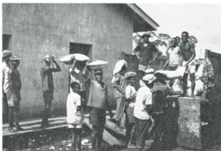
Saltlastning — arbetskraft saknas inte.

När världens ögon sommaren 1968 riktades mot Nigeria—Biafra hade kriget där pågått drygt ett år, men i skuggan av Vietnam och junikriget i Mellersta östern. Det var först resultatet av Biafras inringning — svälten — som fick omvärlden att vakna.