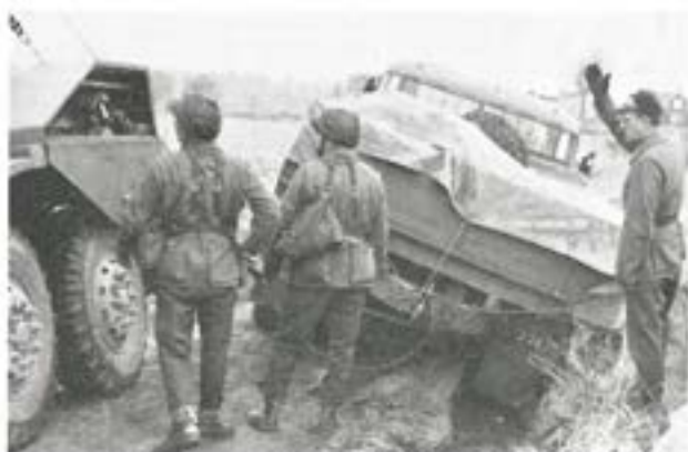
Svag väggkant viker ofta för stor lass! Mj Tingdahl och bärgningsbil viktiga länkar i uhbatövn nr 2 i december 1968.