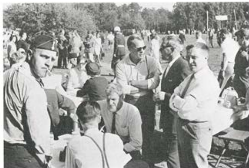
ÅskådARBILD från regementets dag 7 september 1968.

När dessa rader skrivs — i januari månad — är det högst ovisst både hur nuvarande hjälpaktioner ska kunna fortsätta och om de är tillräckliga. Att i en tidskrift som denna göra högaktuella förutsägelser är icke möjligt utan jag vill bara till sist säga, att om — när detta läses — det fortfarande är möjligt att lindra nöden i Biafra, så gör det med en slant, om än aldrig så liten.