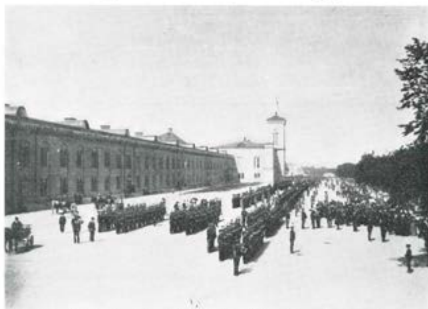
Från Oscar II:s besök på Karlsborg 1898. Trängbataljonen är uppställd närmast kyrkan.

Konung Carl XIV Johan, som med sin stora krigserfarenhet ägnade mycken omsorg åt vårt lands försvar, biträdde en ny plan, grundad på s. k. centralförsvar. Norr och söder om Vättern skulle byggas operationsfästningar och i mitten en förrådsfästning, avsedd att utgöra en tryggad upplagsplats för härens förråd och för statens och riksbakens dyrbarheter.