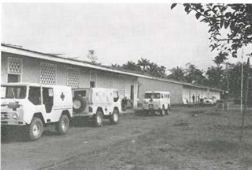
De välkända »Valparna» i Afrika-miljö.