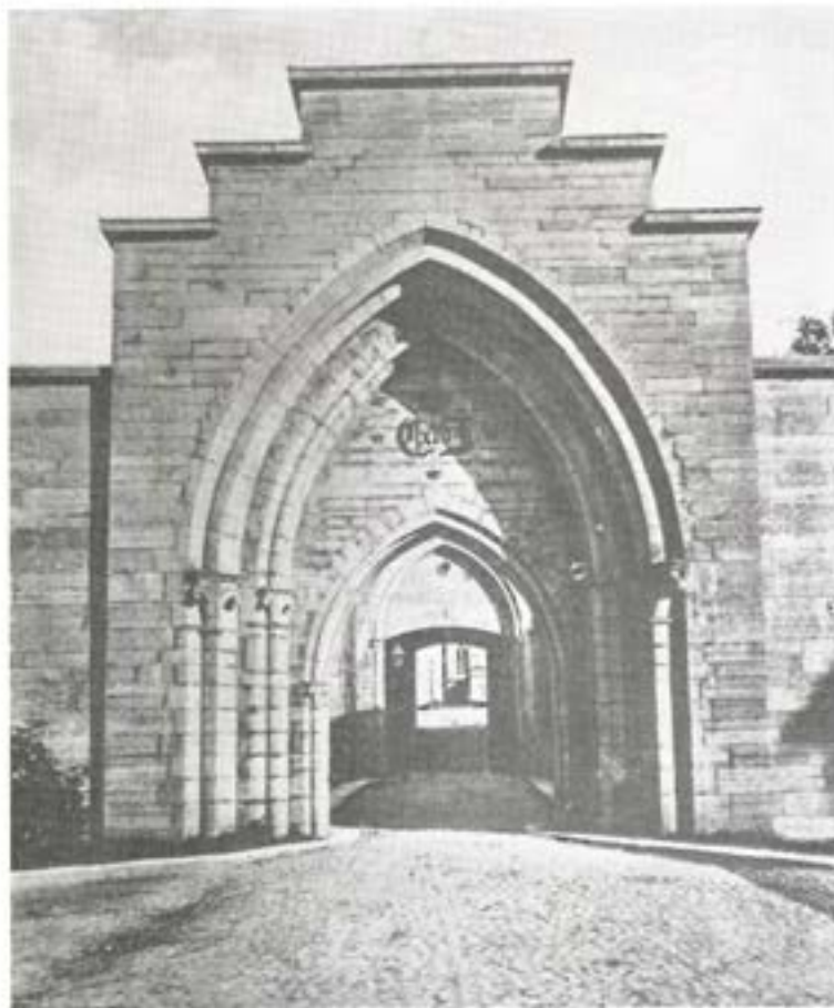
Karlsborg, Götiska valvet vid sekelskiftet