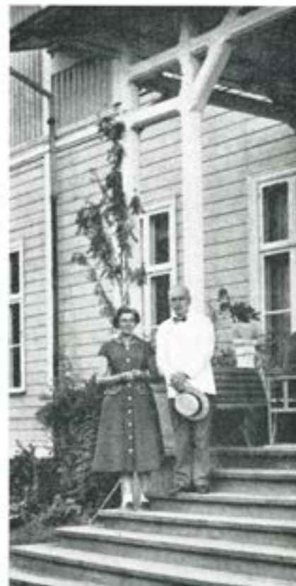
Författaren med hustru 1957