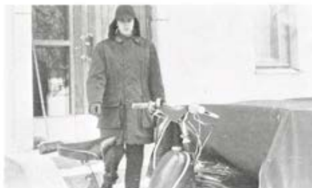
Postordonnansen Hedberg, 11. komp, under sina dagliga turer inom regementets område.