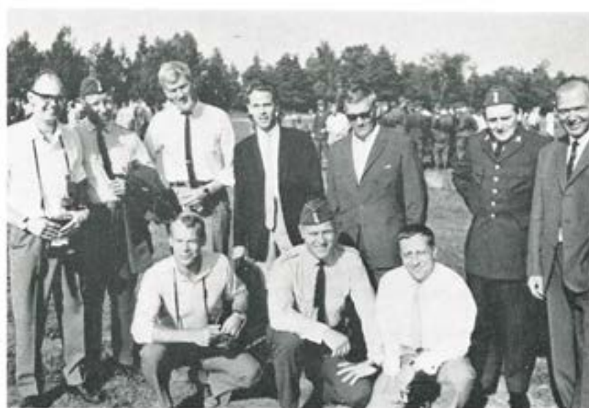
Några av 1943 års volontärer vid regementets dag 1968.

Vad är det man tänker på och vad talar man om när man vill återuppliva vad som hände för ett kvartsekel sedan? Minnena tränger sig naturligtvis på när man återser gamla volontärkamrater. Minns, du kommer du ihåg? Ja, det är tusen och en episoder som tas fram ur minnenas gömslen och det mesta framstod som hade det hänt i går. Inte alla minnen var glada, något ville man väl helst dra en om inte glömskans så dock tystnadens, slöja över. Sättet att använda sig av befälsvärdet så som ibland skedde reagerar vi kanske mer för i dag än den gången, även om vi redan då tyckte illa om missbruk och godtycke. Mest var det, som väl alltid i sådana här sammanhang, de ljusa minnena man tog fram och glädde sig åt. Det var många goda och hjärtliga skratt som hördes