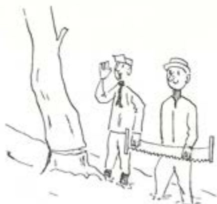
Det var tack vare försynen vi klarade oss under vinterutbildningen.

Men vi fick raster också, "i anslutning till dungen rast vila!" Man ligger på rygg och ser de sommarvita molnen driva ovan trädskronorna och känner det svala gräset mellan fingrarna och rüken, som sakta ringlar upp från pipan och vinden mjuk mo: ögonlocken.