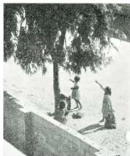
Att skaffa bränsle är ett av de dagliga bekymren. Här är ett sätt att få tag på det.