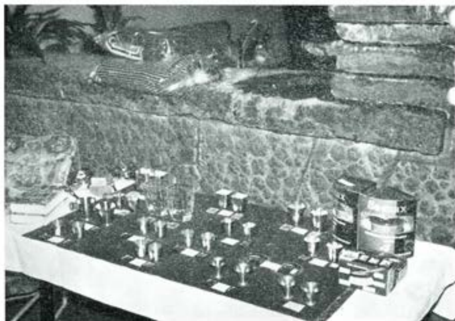
Den imponerande prissamlingen värderad till ca 3.000;— kr och skänkt av landets ledande oljefirmor.

T2 fick som arrangör icke deltaga i tävlingen, en upplysning, som jag hoppas skall lugna en del götaträngare. T2:s lag brukar nämligen också återfinnas i toppen.