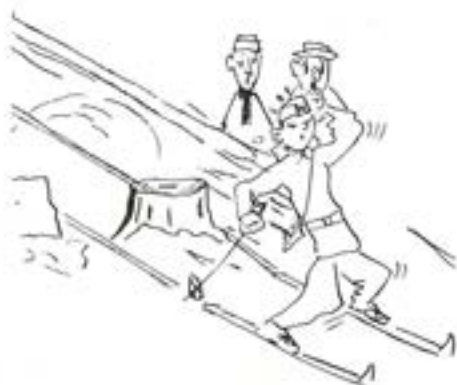
Inga olyckor på grupp K.