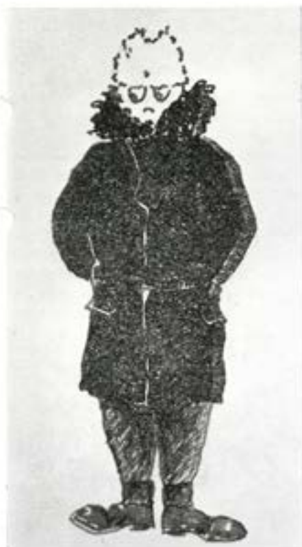
Vi fick ut FNU.