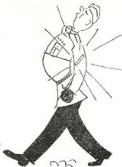
Vicekorpralsutnämningen. "Konungen hafter i näder . . ."