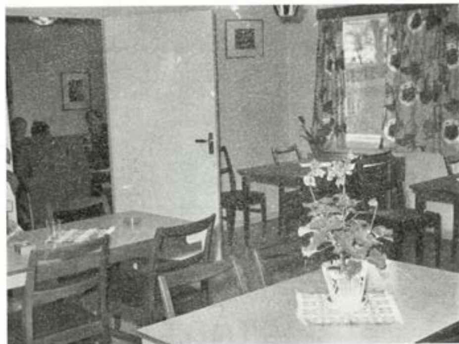
Underbefälsmässens lunchrum med ett av sällskapsrummen i bakgrunden.