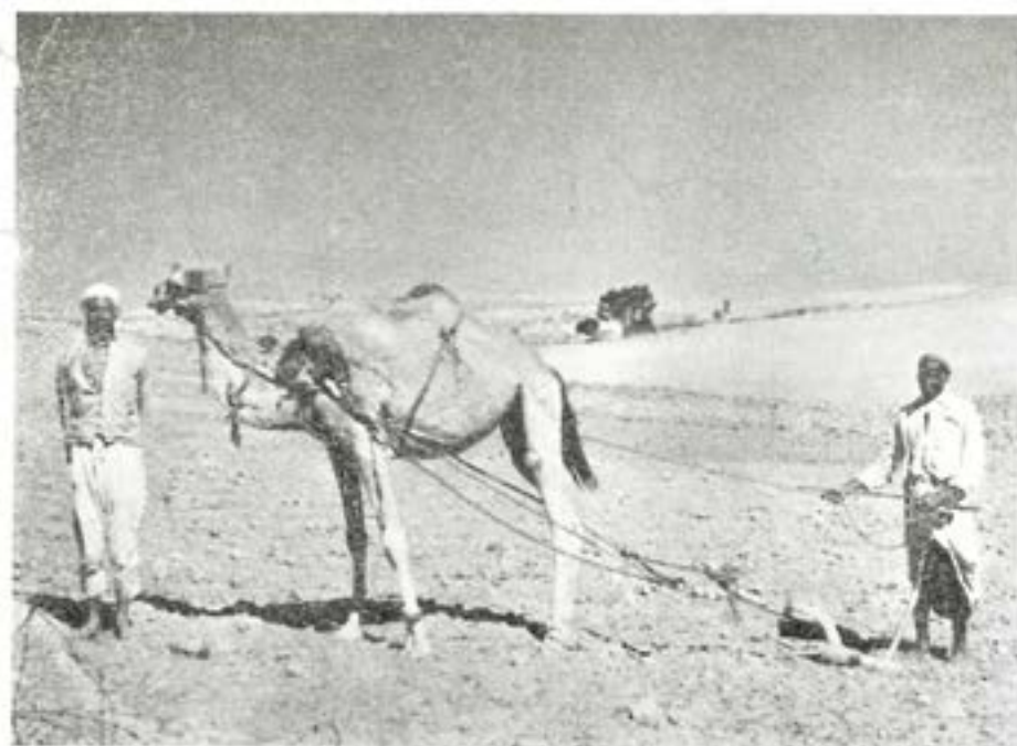
Det är lika primitivt som det ser ut. Fårorna blev inte djupa. Traktorplogning hade börjat komma till användning på många håll.

om människor, som måste leva på detta sätt, utan att kunna se skymten av "den ljusnande framtid". FN har ännu icke lyckats bringa flyktingfrågan till någon lösning. Egyptiernas enda förslag till lösning är, att jaga bort judarna ur Israel, så att flyktingarna kan återvända till sitt forna hemland. Intill dess detta kan ske, synes flyktingarna hänvisade till detta liv i armod — som en bricka i det politiska spelet.