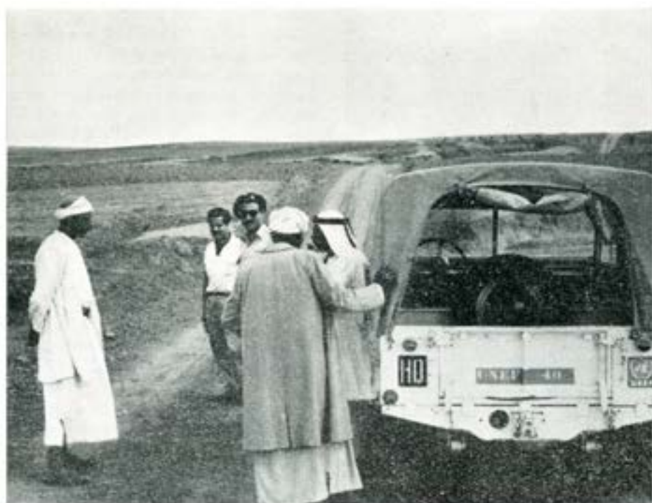
Vägen längs stilleståndslinjen. Den senare var markerad med en djup plogfåra (i övre vänstra delen av bilden.)

sesivt tillförts förbanden för att därigenom skapa större enhetlighet. På senaste året har mycket stora ansträngningar gjorts för att genom ytterligare tillförel påskynda standardiseringen. Den skiftande utrustning som härigenom funnits och fortfarande finns har skapat många underhållsproblem. Reservdelsfrågan måste bli