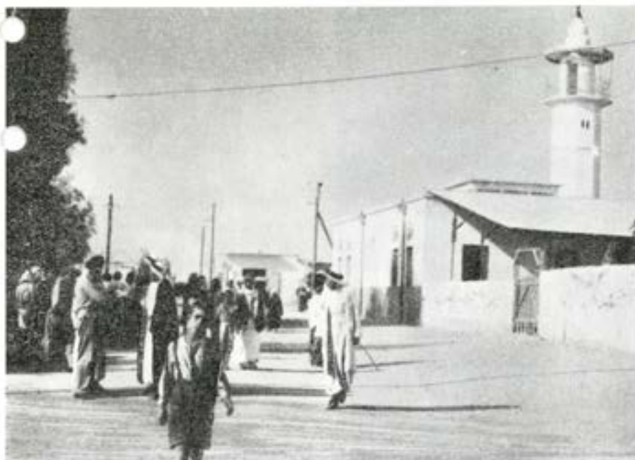
Vy från en liten gränsby. Moskéer fanns av många olika typer.

anser att en försumlighet bör beivras, men chefen för vederbörlig kontingent är av annan uppfattning. Allting, om uppfattningarna divergera och förseelsen bedöms som svår, kan självfallet chefen för FN-styrkan hos vederbörlig nations regering göra framställning om att den försumlige hembeordras.