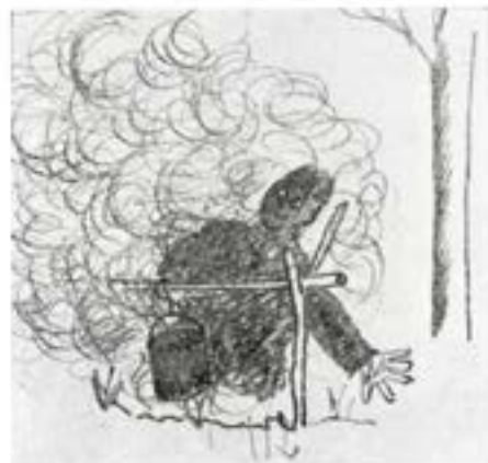
— — — kokade vi den härligaste kött-ris-stuvning.

På norra fältet övade vi sedan betjäning av brigamplats och körde omkring och ropade "Bil nr ett mot upplag nr tre",