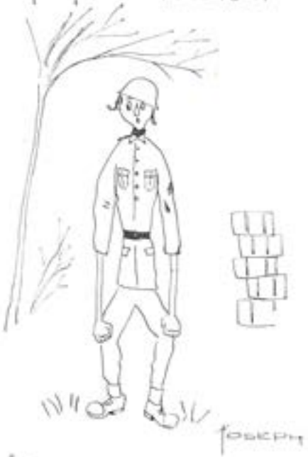
"Tju, en annan lossa ju ammunition i Levene alltså!"