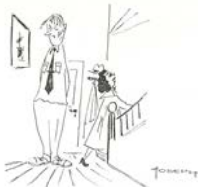
Mamma! Pappa! Gusten har blivit befördrad från Furir till Korpra!!!

Sommaren blev varm och med en myckenhet av sol, och i tidningarna läste vi, att badstränderna befolkades till huvuddelen av vackra flickor, och vi suckade. Suckade gjorde vi även den eftermiddagen ute på fotbollsplanen, då öfurir Jonny hade tävling med oss i de olika förflyttningstätten. För civilt bruk nyttjar man ju endast två sådana, fotmarsch och bil-