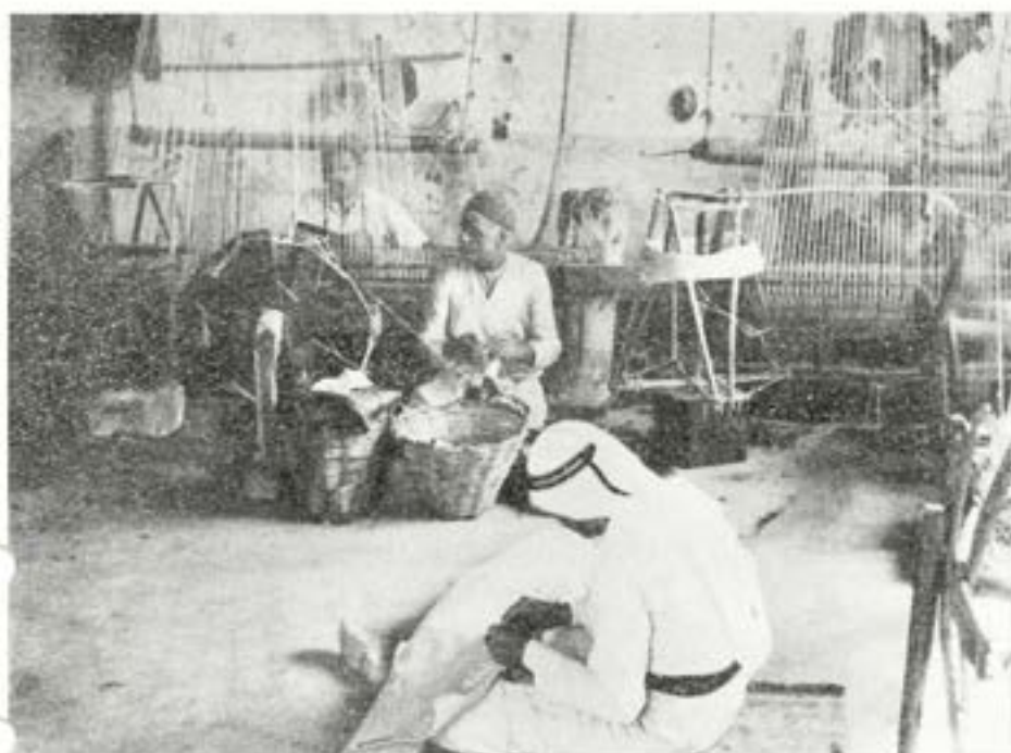
Interiör från ett mattväveri i Gaza. Redskapen är primitiva, men mattor blir det i alla fall.

peace". Och när man sett de förutsättningar som finns, måste man säga, att detta är lika överraskande som glädjande.