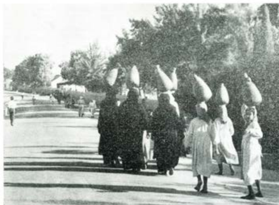
På väg till källan för att hämta vatten. När krusen var tomma bars de ligande eller lutande. Man förväntar sig över klädseln i värmen.

svåröst när det bland det totala antalet motorfordon (ca 900 st) fanns inte mindre än 325 olika fordonstyper och av vissa fordonstyper endast ett fordon, eller när det av 130 elverksgeneratorer fanns 30 olika typer. Om man härtill lägger de problem som de uttänjda underhållslinjerna skapar, förstår man, att där kräves