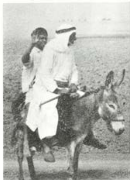
Ett vanligt transportmedel, både för personal och gods.

Chefen för FN-styrkan har ingen bestraffningsrätt över medlemmarna i de olika nationernas kontingenter. Denna rätt ligger helt i händerna på vederbörlig nations kontingentschef. Det kan måhända uppstå problem om chefen för FN-styrkan