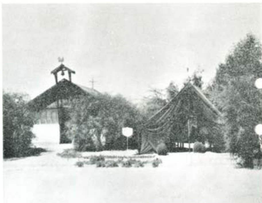
Från svenska stabskompaniet. T h bataljonschefens exp, t v kapellet.

som ett dopp i Döda havets tunga och av sältan nästan oljiga vatten. Ja, det gick att komma ner i vattnet, men man flöt kvickt upp till ytan igen för att slutligen hamna ovanpå vattnet!