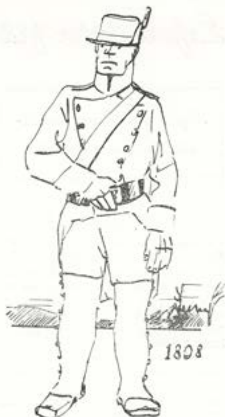
Soldat i uniform m/1808.