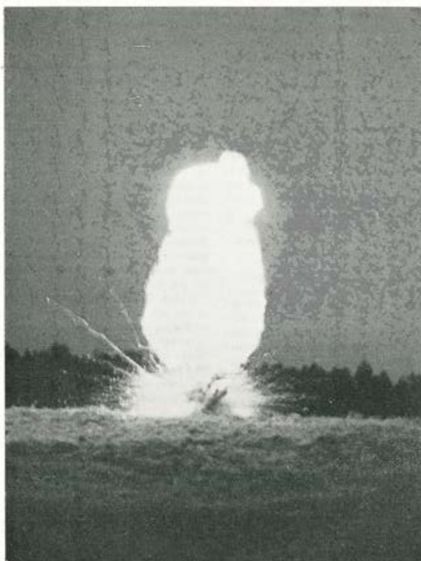
Bombexplosionen i hökensåsskogarna blev ett storartat skådespel.

Tro mig eller ej, men T 2 atombomb-anfallsövning i Tidholmstrakten utlöste en nog så ettrig tidningspolemik, där t o m vår ärade kollega "Expressen" var inblandad. Den intresserade hänvisas till T 2 urklippsbok, förvaltd av öfver Karlsson.