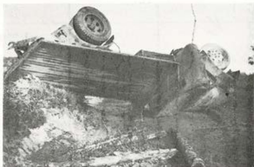
Atombomben sätter käpp i hjulet för bilföraren.