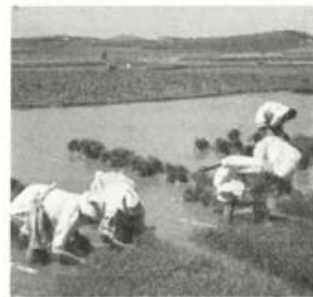
Risplantornas omplanteras i Kaesong, Panmunjom.

Däremot hade nordkoreanska armén vid ett tillfälle under min vistelse därute ar-