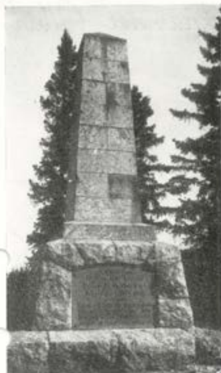
Monumentet över slaget vid Oravais.

ställningen. Men Kamenskij var fast besluten att nå ett avgörande. Ungefär kl. tio på kvällen, i fullt mörker, gick han till angrepp rakt fram mot åsen, medan Demidov sökte kringgå vår vänstra flank. Adlercreutz gav tappt, hären fick i nattens mörker dra sig tillbaka mot Nykarleby. Atertåget urartade ställvis till flykt. Svenskar och finnar hade förlorat 1.200 man, fienden något mindre. Därmed var finska krigets hårdaste och blodigaste drabbning avgjord. Dock var den bittra kalken ännu ej tömd. Fortfarande återstod det långa återtåget norrut, de fasasfulla kvarteren i Torneå, fältsjukan, kapitalution i Kalix och Finlands förlust.