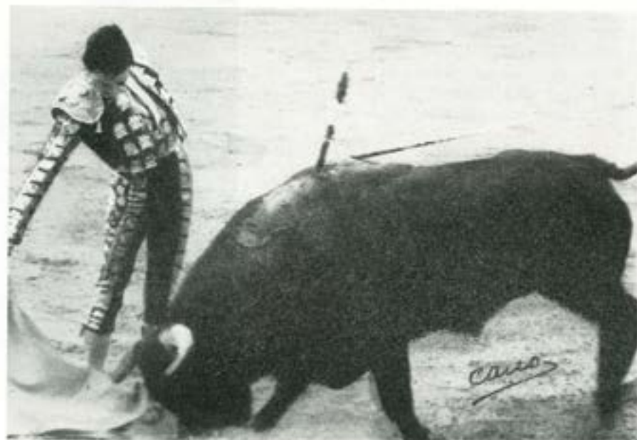
Klassisk tjurfäktarpose (inte, som intendentursoldaten kanske tror, slakterigrupp i arbete).

min uppgift långt ifrån fylld. Steget från några undertecknade papper till en i praktiken fungerande och ekonomiskt bärande organisation är långt i ett land, där man inte ser på punktlighet och givna överenskommelser med samma ögon som