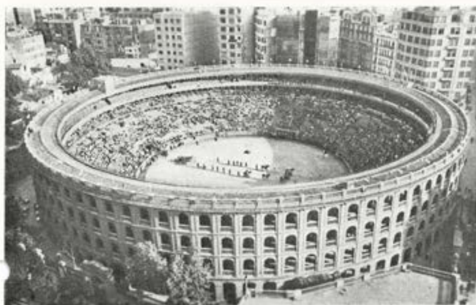
Tjurfäktningsarenan i Valencia.

ra kunde visa tålmod. Jag vandade mig så småningom att liksom spanjoren använda ordet mañana — i morgon — i min underhandlingsteknik och jag fann att ett viktigt avtal bättre leder till resultat vid en aperitif eller en kopp kaffe på ett café än vid skrivbordet. Jag blev oriental till tänkesättet.