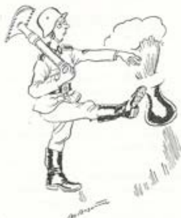
(Teckning Bo Bojesen).

Om den noggranna marschen skall finnas också i den nya tyska hären är visst icke riktigt klart ännu, bestämt är emellertid att rakningsreglementet från 1931 är fortfarande oförändrat och det är värt citera en del ur.