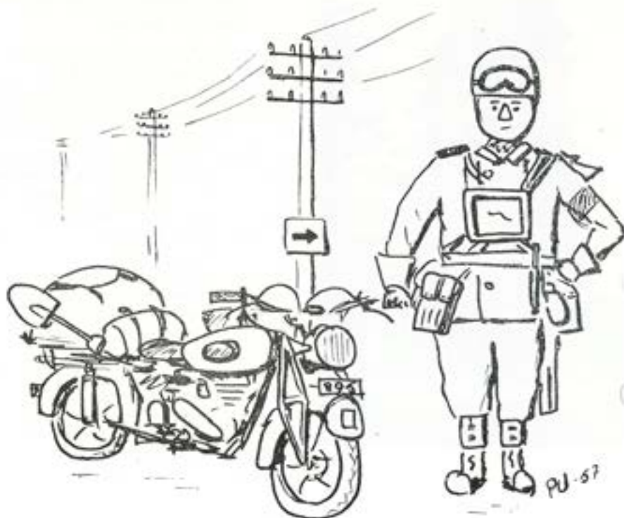
Trafiksoldaten med sin käre "Albin". (Teckning av befälseleven Per Udden).

Härmed är vi inne på materiellvården. För vårdandet använder sig trafiksoldat av hammare, mindre kul- och sk materiellvårdsschema på vilket står uppfört ett 40-tal vårdpunkter. Efter varje punkts