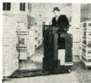
Ameise smalspårig gaffelstaplare, avsedd för den svenska standardlastpallen. Lyfthöjder upp till 3,3 m i standardutförande.

Genom att endast representera och sälja fabrikat med ett grundmurat gott anseende och med stora resurser och lång erfarenhet bakom sig, vet vi att vi även i framtiden skall kunna erbjuda våra kunder god service och reservdelshållning för dagens modeller.