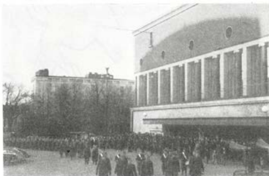
Regementet marscherar upp på Götaplatsen