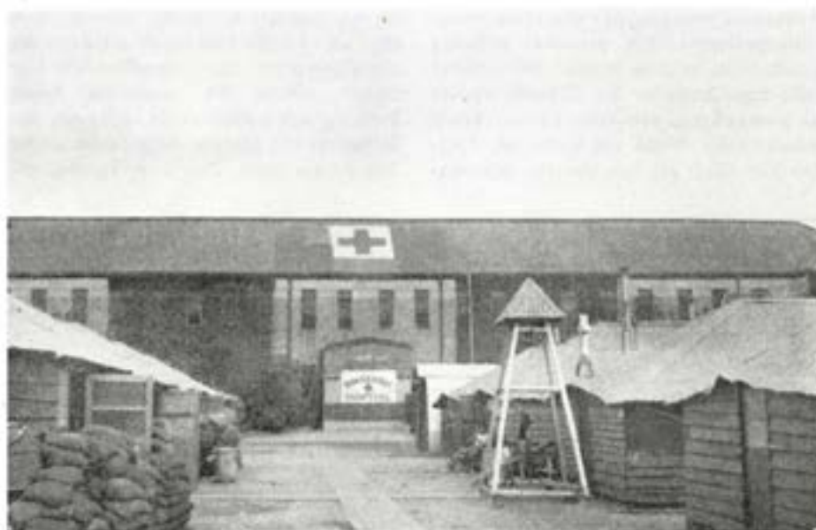
Baracker och svenska kyrkan med operationsavdelningen i bakgrunden

Ät hygienien måste särskild uppmärksamhet ägnas, när här ute finns allsköns sjukdomar. Före avresan från Sverige blir man vaccinerad mot smittkoppor, kolera, tyfus, paratyfus, stelkramp m. m. och vid behov kompletteras vaccineringsarna under uppehållet i Tokio. Vid SRCH förekommande hygieniska åtgärder består bl. a. i att med DDT bekämpaflugor, mygg och andra småryp. Innan man går till sängs besprutas rummet med ovannämnda insektsmedel, varefter man stoppar moskitnätet väl omkring sig. Med jämna