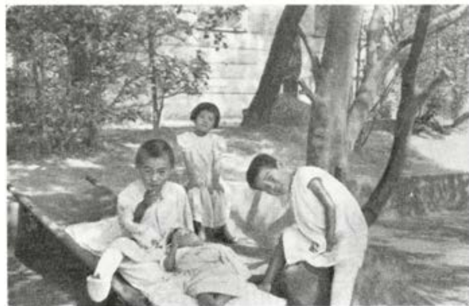
Fyra små patienter.

Sjukhuset är inrymt i en handelshögskola. Uppfarten till detsamma är inte så särskilt pampig. Från huvudgatan, som numera är asfalterad färdas man en smal krokig och smutsig gränd fram till den av svenska poliser bevakade infarten. Ovan den enkla portalen vajar den svenska flaggan mellan FN:s och Röda korsets flaggor. Stommen i sjukhuset utgöres av två st. i två våningar byggda stenhus. Nedre våningen i den närmast infarten belligna byggnaden inrymmer mottagande avd., förbehandlingsrum (preop), röntgen, sterilisation, tre st. operationsrum med plats för fyra operationslag samt slutligen den s. k. postop, där de nyopererade fallen läggs in så långt utrymmet räcker. Genom att på detta sätt samla de nyopererade underlättas kontrollen av dessa patienter. Övervakningen är ordnad som vårdavdelning. Samma är förhållandet med hela den andra byggnaden. I den senare har dessutom amerikanska röda korset