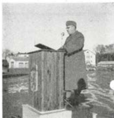
Regementschefen avtackar åldersklassen

Vid ett sådant tillfälle som detta ser man gärna tillbaka och frågar sig: hur har det varit, vilka resultat ha uppnåtts? Jag vill först säga några ord om åldersklassen. Befälstillgången intill mitten av oktober har varit svag. Då så är fallet, blir lätt anda och disciplin dålig. Så har emellertid ej varit fallet. Tjänsten har fullgjorts med gott humör. Disciplinen i tjänsten har i huvud-