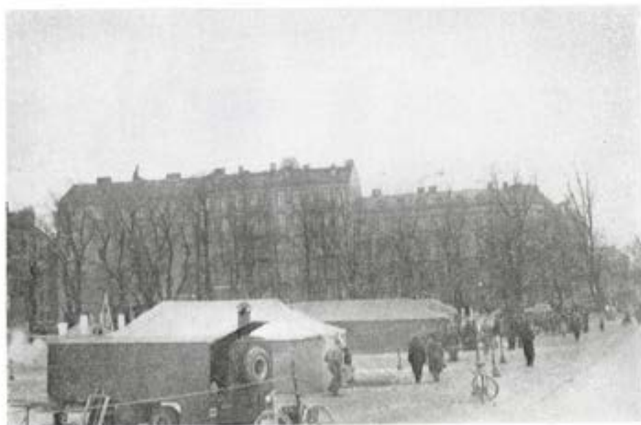
Utställningen på Heden, söndag morgon strax före öppningsdags

ket lyckat fullföljande av ett lovvårt initiativ, allt igenom populärt hos göteborgarna.