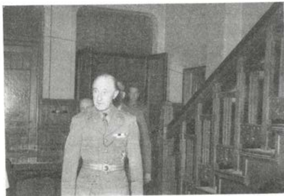
Militärbefälhavaren anländer till kontoristföreningen

Man kan naturligtvis diskutera huruvida det finns grundad anledning eller icke att utanför den interna kretsen celebrera en kamratförenings 20-åriga tillvaro. När regementets kamratförening i Göteborg redan hösten 1953 började planlägga jubileumsfirandet med den utformning det i stort sett sedermera fick — med "försvarexpo" på Heden, korum på Götaplatsen, middag med celebra gäster o. s. v. — saknades icke röster, som förfäktade att föreningen led av hybris. Nu när evenemanget väl är genomfört, ha dessa röster alltmer överröstats av dem, som i anordningarna såg ett enstående väl valt tillfälle att förverkliga de mål kamratföreningen satt sig före, samtidigt som regementet fick tillfälle att presentera sig för en allmänhet, som dittills haft endast diffusa begrepp om vad "trängen" är för något. En kamratförening, som endast gräver ned sig i minnen från fornstora där, tappar snart kontakten med den växande generationen och riskerar att föra en alltmer tynande tillvaro.