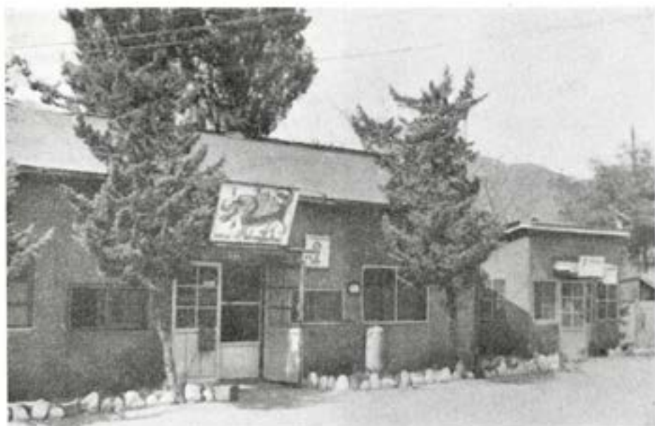
Apotek, laboratorium (Flygande Draken) och vakstuga

mellanrum besprutas sjukhusets ytterområde med DDT-lösning och varje lördag behandlas hela Pusanområdet på motsvarande sätt från luften. Koreanska patienter eller besökare måste finna sig i att få sina kläder DDT-behandlade innan de släpptes förbi vakten.