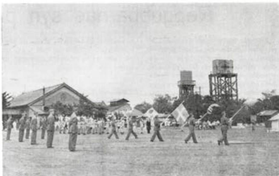
Parad för fanan på 3-årsdagen. Fanorna äro fr v Röda korsets, Koreas, Sveriges, USA:s och FN:s

Den 23 september 1953 hade sjukhuset varit i verksamhet under 3 år. 3-årsdagen firades med en enkel men värdig militär högtidlighet till vilken inbjudits