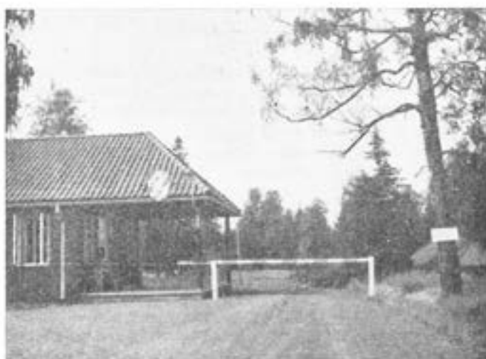
Entrén till T 2 N med vaktlokalen.

Staden har överlåtit markområdet till kronan. Men vi befinna oss i Bergslagen, och där är det viktigt att hålla