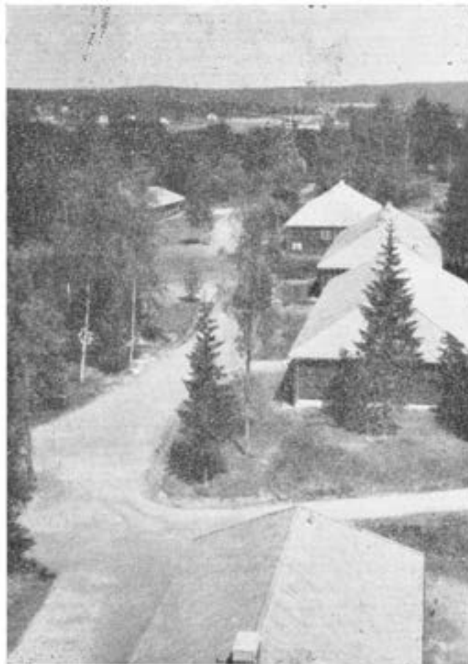
Kasernområdet från värmecentralens skorsten. I förgrunden matinrättningen och i bakgrunden till vänster kanslihuset.

Vid T 2 N utbildas för närvarande endast värnpliktiga i sjukvårdstjänst. Förbandet är ordnat på två kompanier: 5. komp. (nummerordningen hänför sig till T 2) utbildar värnpliktiga tilldelade tränstrupperna samt rekryt- och plutonchefskola för värnpliktiga läkare grp 4. 7. komp. utbildar värnpliktiga ur andra truppslag inom V. milo, uttagna till sjukvårdstjänst. Personalstyrkan 1/7 1947 var omkring 270 man; därunder 5 officerare och 5 underofficerare (förutom arvodesanställda tygunderofficerare och förrådsunderofficer).