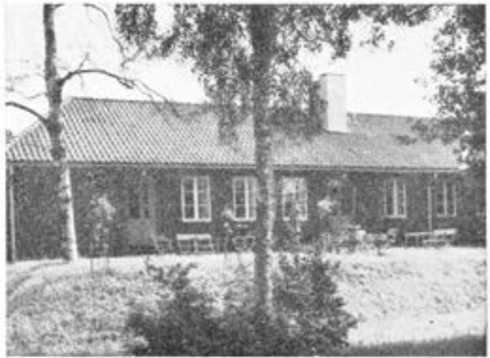
Baksidan av officers- och underofficersmässarna med trädgårdsanläggningar.

Central radioanläggning är inmonterad i kanslihus, kaserner och matinrättning. En högtalare finnes utomhus.