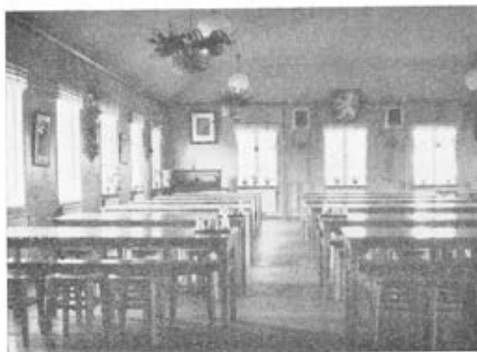
Interiör av matsalen.

Kasern är granne till stadens idrottsplats, och denna får användas så gott som obegränsat. Sommartid äger även gymnastik rum på idrottsplatsen och vintertid hyres stadens gymnastiksal vissa timmar. Då denna emellertid är mycket upptagen, hoppas vi snart få egen dylik. Bastu saknas likaledes inom kasern, och därvid är T 2 N hänvisat till stadens badhus. Däremot finnes sommartid egen badplats belägen 1 km. från kasern.