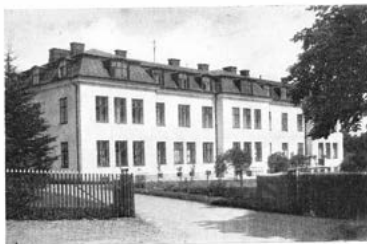
Garnisonssjukhuset i Skövde.