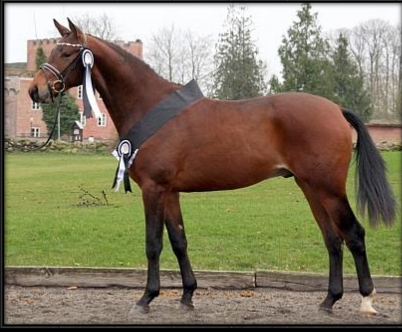
Fløjhingst 2008 Iznogood.

Den knap så lukrative titel: "Foreløbig ikke kåret" opnåede to af de øvrige unghingste.