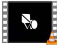
3 Het verdriet van Vukavar