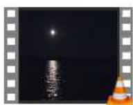
1 Reeuwijk alle tijden

Voor deze avond heeft Ben een thema uitgekozen over de lente en mogelijke fietstochten.