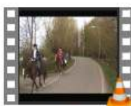
2 De Meije