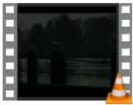
1 Niek bona spes SD