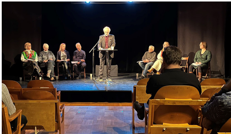
En serie insändare till NSD lästes upp i kronologisk ordning.

I Pajala fanns ca 50 personer på plats och lyssnade under dagens lopp. I Luleå var det ca 20 personer i publiken. I Stockholm tog biljetterna slut och det rymdes ca 60 personer i lokalen.