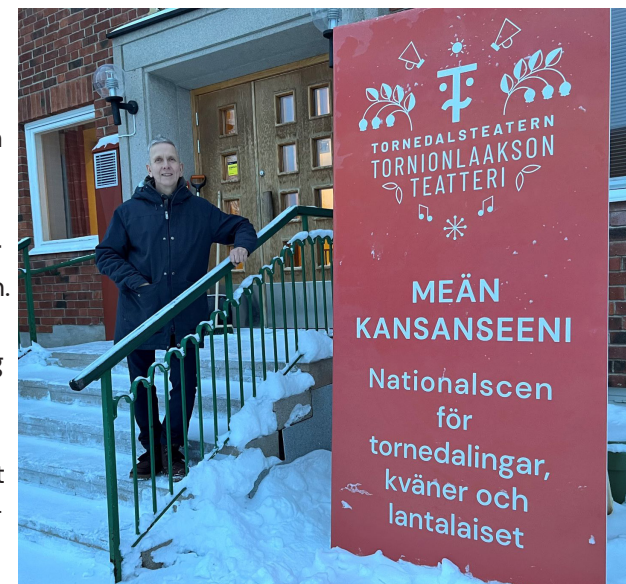
En ny skylt installerades den 15 nov.

För mig har också vittnesmålen öppnat upp en bredare förståelse för hur försvenskningen påverkat oss, och ännu idag klingar kvar hos relativt unga människor med rötter i Tornedalen. Därför känns det extra bra att vi dessutom tog det något kaxiga beslutet att utropa oss till Nationalscen. Det är ett viktigt steg i att markera att vi behövs i hela Sverige.