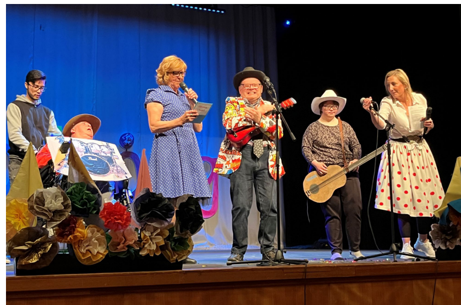
Några av stjärnorna i Regnbågsfamiljen.

Övertorneås revyarbete är också igång. Processen leds av teaterledare Tomas Vedestig och premiären blir under våren 2024.