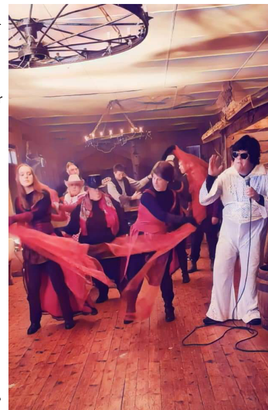
Filminspelning i Karungis saloon.