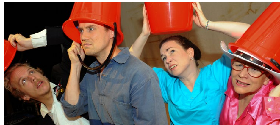
Projektanställda i Kabaré No niin som förgyllde vår vardag .

Därmed har totalt 47 personer haft inkomst från teaterns verksamhet.