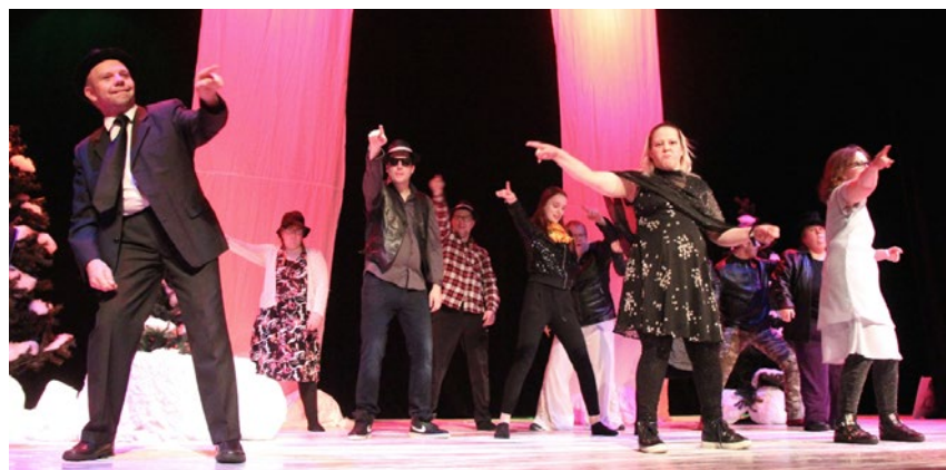
Teaterentusiaster i Haparanda som nu har fått ett eget coolt gruppnamn: The Happy Crew.

Jupin Sisaret i Haparanda innehöll mycket meänkieli utan textning. Produktionerna med barn och ungdomar har tyvärr inte haft mycket meänkieli i sina repliker. Teatern har startat ett projekt med en teatergrupp i Kalmar som tränar in sånger och repliker på meänkieli. "Meän kieli oon teän kieli" som projektet heter visar att vårt språk och vår kultur är intressant även för personer som bor långt ifrån Tornedalen.