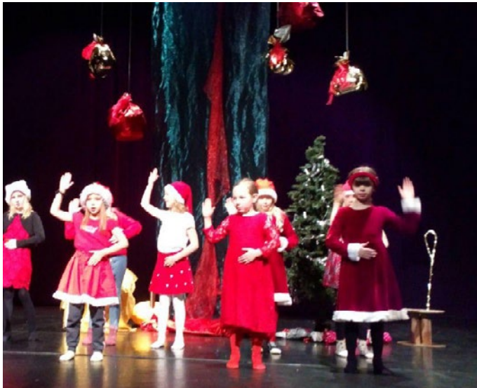
Tornedalens framtida skådespelare på scen i Haparanda