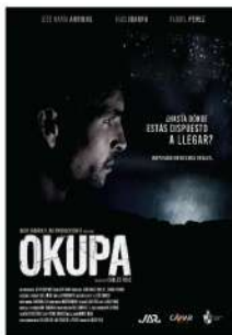
"Okupa" España 9min 16+ Carlos Polo