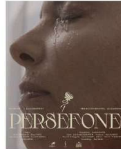
"Perfesone" España 20min 18+ Jurek Jablonicky