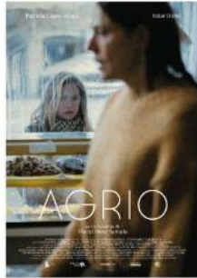
"Agrio" España 18min 13+ David Pérez Sañudo