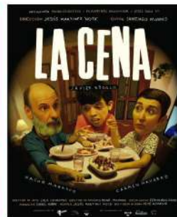
"La Cena" España 12min 12+ Jesús Martínez Nota