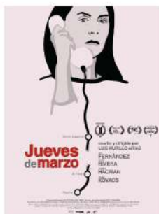
"Jueves de marzo" España 17min 12+ Luis Murillo Arias