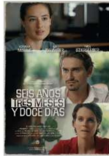
"Seis años, tres meses y doce días" Suiza 8min Ilja Baumeier Kathrin Wüscher