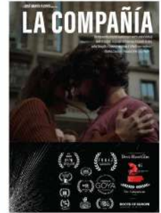
"La compañía" España 12min sin calificación por edad José María Flores