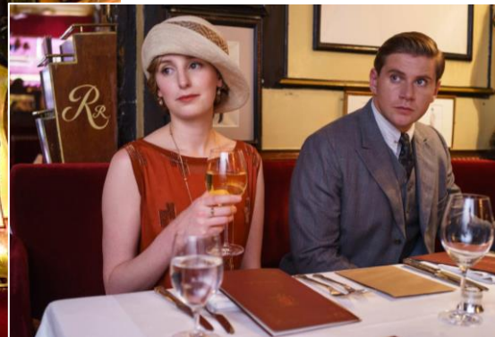
Lady Edith & Tom Branson på Rules

Rules – Londons ældste restaurant er beliggende i Covent Garden. Her serveres klassiske britiske retter i elegante omgivelser, hvor væggene er fyldt med portrætter, og stemningen føles som en scene fra en roman. Det er pænt tøj og højt til loftet – et mindeværdigt punktum for dagen.