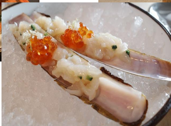
Grønlandske snekrabber, knivmuslinger og søpindsvin