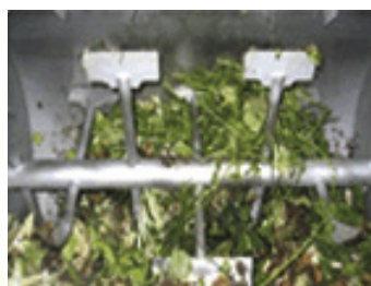
Maskin i arbeidssyklus