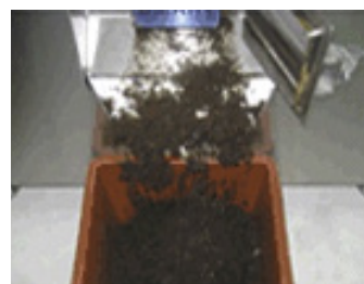
Tømming av tørket sluttprodukt.