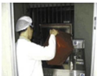
Legg i matavfall

Det finnes ikke en enkel løsning for å nå FN-kommisjonens mål om en ny klimaøkonomi. Utnyttelse av matavfall gir dobbel klimaeffekt, og sørger for resirkulering av næringsstoffene. Uten behandling vil organisk matavfall som råtner slippe ut metan som er mange ganger mer skadelig for klimaet enn CO 2 utslipp.