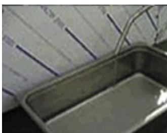
Automatisk kondensvann utskiller