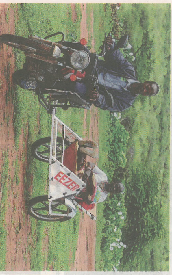
En motorcykel-ambulans som rullar i Afrika.