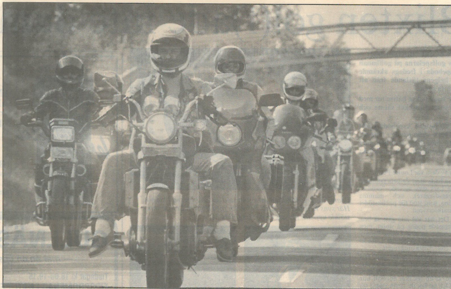
Nära 500 motorcyklar var med på årets motorcykelkortege genom Falun, i ett ca en kilometer långt tåg. Det är frihetskänslan som är det viktiga! säger motorcykelentusiasterna själva.