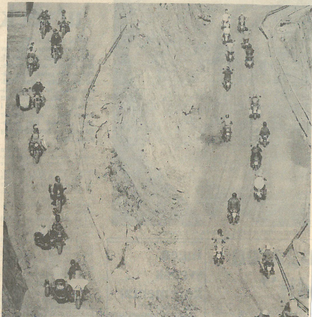
På slingrande vägar ned i Stora stöten rullar de 323 motorcyklarna — något som numera är tradition.