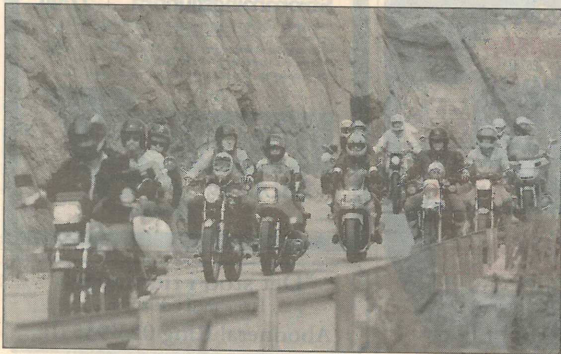
Det mullrade svagt när de drygt 400 motorcyklarna gled nedför vägen mot Stora stöten.