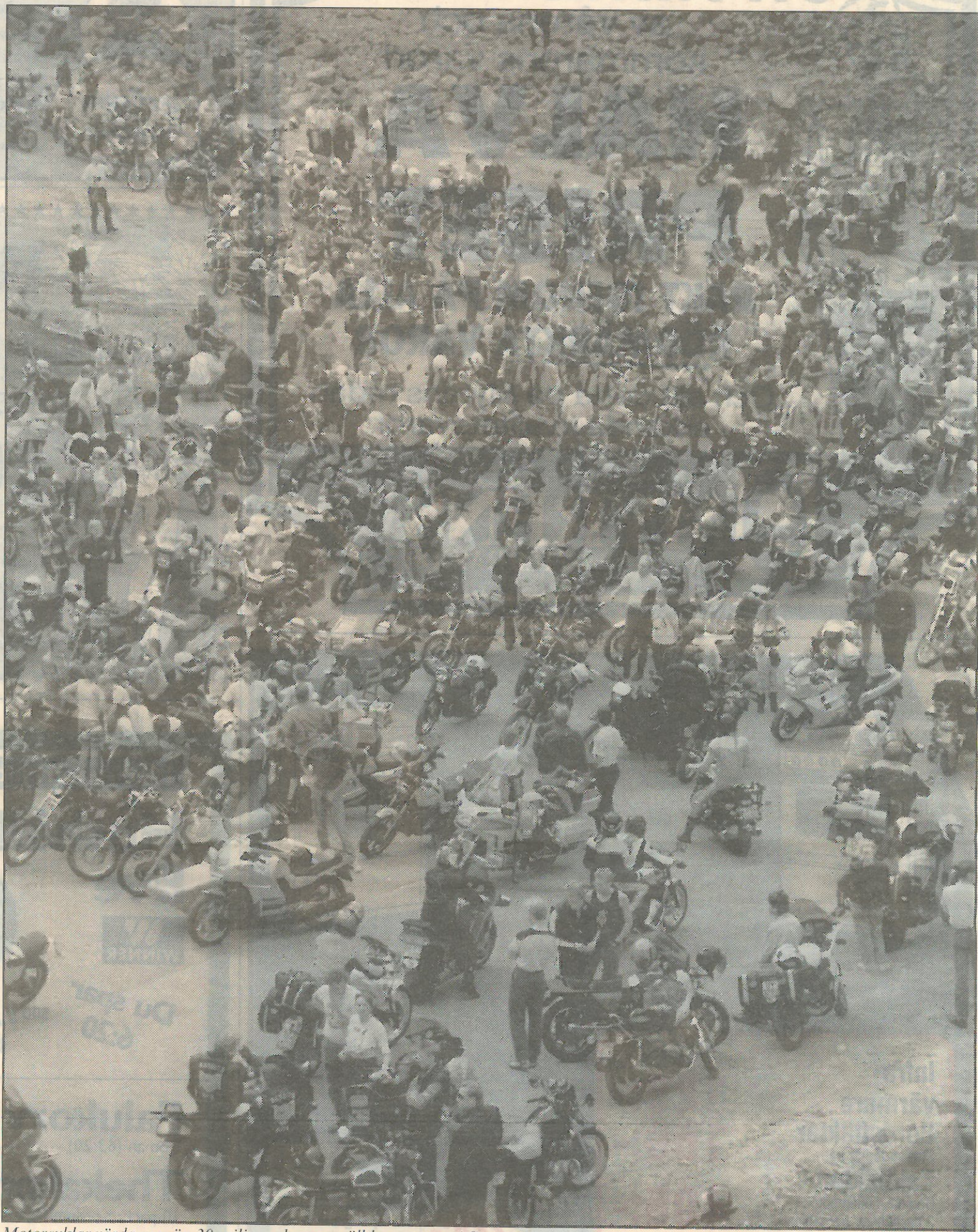
Motorcyklar värda mer än 30 miljoner kronor ställdes upp nere i Stora stöten när "Kopparträffen" besökte Falu gruva.

färgen här i Sverige, berättade en person för en utländsk gäst.