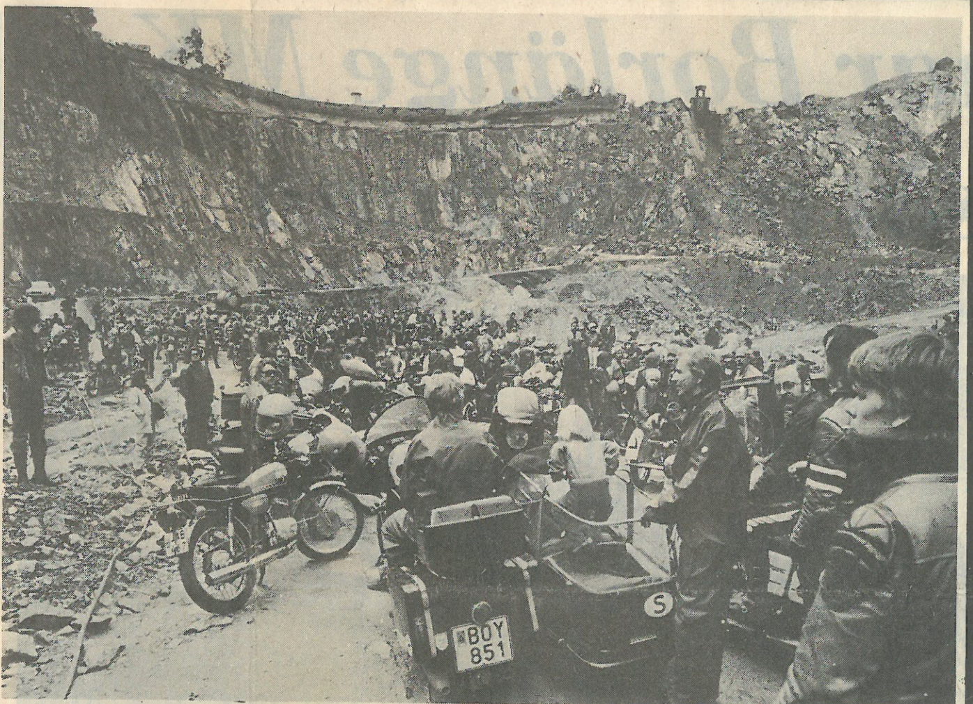
Kopparträffen i Falun befäster sin ställning som en av landets absolut populäraste mc-träffar. Trots ett miserabelt väder hade i år närmare 600 mc-åkare från hela landet mött upp. En av höjdpunkterna under träffen var kortegen genom Falun och den efterföljande nedfärden med motorcyklarna i Stora Stöten på lördagseftermiddagen..