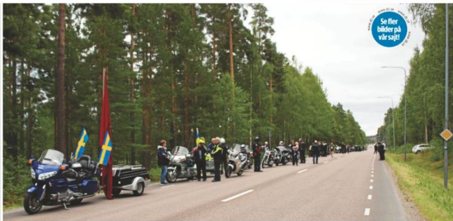
Ledet sträckte sig några hundra meter långt med Ingarvsvägen.