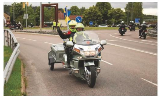
En glad vinkning som avslut på en lyckad kortege innan alla var fria att åka var de ville.