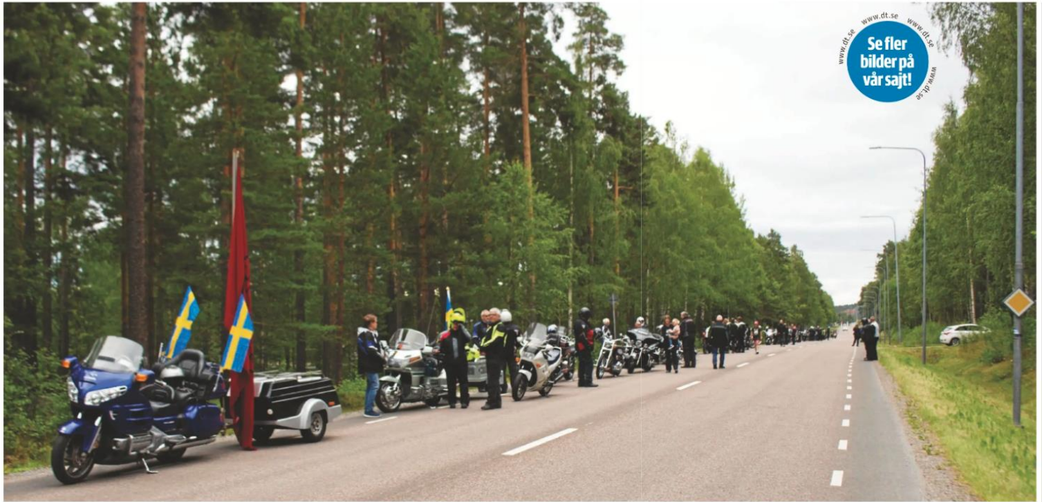
Ledet sträckte sig några hundra meter längs med Ingarvsvägen.