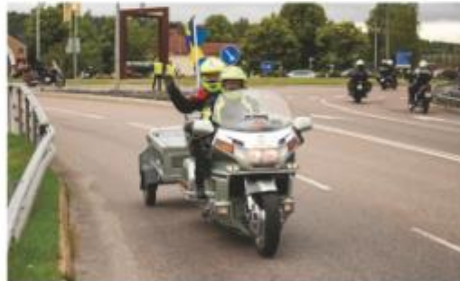
En glad vinkning som avslut på en lyckad kortage innan alla var fria att åka ut de vilt.