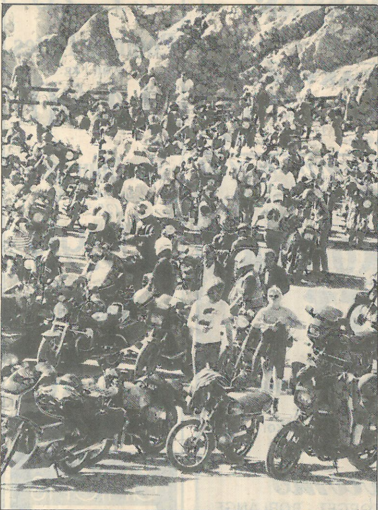
DET blev trångt i Stora Stöten när cirka 330 mc-ekipage samlades där efter kortegen genom Falun.