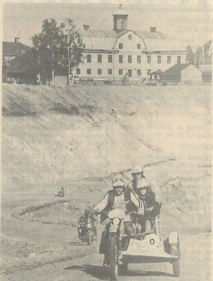
Falun invaderades i helgen av 430 motorcyklar (en del som synes med sidovagn) och 570 mc-entusiaster. De deltog i den sjunde Kopparräffen, som samlade rekorddeltagande.

Twin Club kommer igen nästa sommar, och lovar då komma med en del intressanta nyheter.