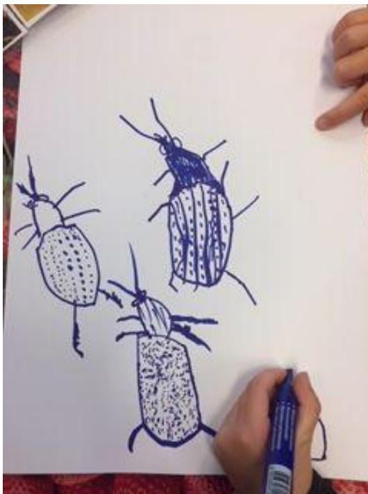
Sam uit groep 3 bestudeerde kevers.