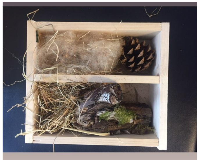
Groep 5 bouwt aan een insectenhotel.