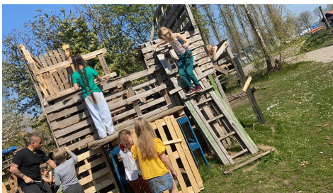
Foto's van het hutten bouwen bij Jeugdland.