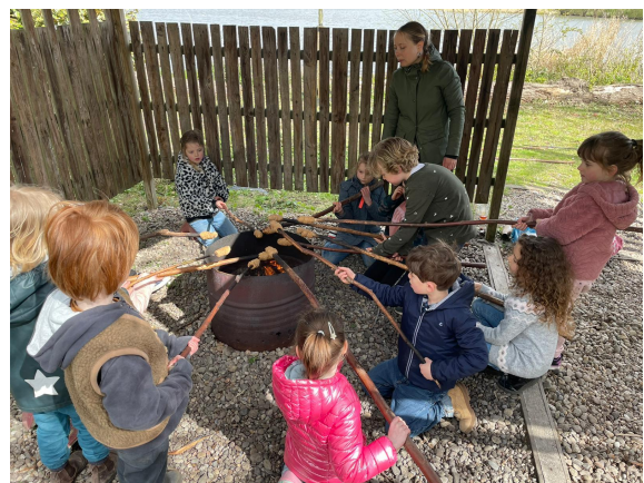
Foto van het broodjes bakken bij jeugdland.