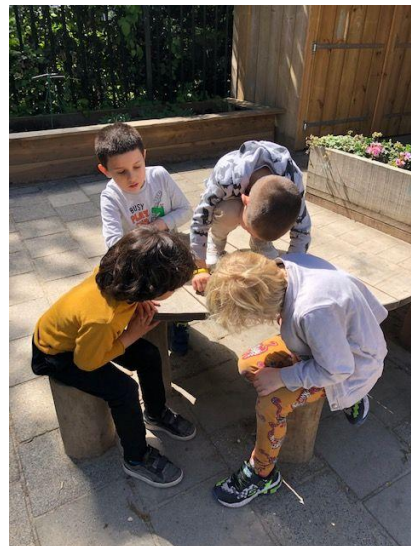
Foto's van kinderen die bezig zijn met 't thema: kriebelbeestjes.