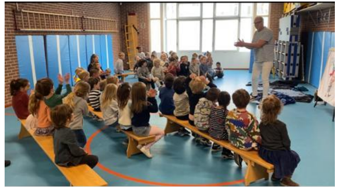
Foto's van de voorstelling.