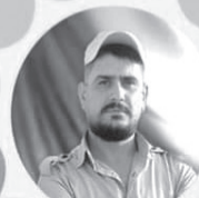
ŞEHÎD RÊNAS HISÊN