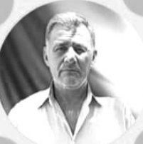
ŞEHİD RIYAD HEMO

هذه المقالة و النظريات من ثلاث قادة مقاومين في ثورة روج آفا، ثلاث طليعين من حزينا، ثلاث نجوم شعبنا، النساء والشباب اقتدوا بهم اقوالهم من اجل رفاقهم السائرون في دربهم اصبحت نورا لهم، لان معرفة باران سرحد احمد شورش و يلماز بحرارش خطوة على طريق التعلم لمعنى الثورة. في البداية ما نتعلمه من الرفاق هو الارتباط بالشهداء، في النضال كافراد الذين قاموا بالثورة. لان شهدائنا احياء في حياتهم، ان هدفهم من اجل تقدم ميراث الثورة هو مهام و نضال لم يخدمهم من اجل التقدم الى الامام ومن هذا قال باران سرحد "ان الارتباط بالشهداء ليس بالكلام انما بالعمل والنضال"، لقد جعلها شعار له في النضال. وذلك لانه عندما كان يلماز بحراً رش، رفيق باران، يكرر واجباته أو عندما كان، رفيقه فرهاد عربو پروي، كان يوعده بالانتقام. وذلك لأنه عندما قال أحمد شورش، برجم ريناس: أن مستوى النشاط بدأ من هنا، أو عندما قال فرهاد عربو "إذا لم يتمكن من أن أصبح تشي كيفارا، فذلك بسبب افتقاري إلى فيدل" أهمية إكمال المهمة كتبت نفسها فينا لقد عرفوا خالدينا بأنهم السمة المميزة للقيادة وساروا على العدو. كان رفاقنا أشخاصاً علمونا الثقة والتواصل وحب الناس. غالباً ما يكون التعلم أمراً بديهيًا بالنسبة لأولئك الذين يريدون أن يروا. عندما تتفاعل معهم، ترى الحب الإنساني يشحن بالعمل الجاد. ولهذا السبب يقبل الأطفال صورههم، ويحملها كبار السن لهم. الجميع يعرف عمل وحب الرفاق. كل نقاشاتهم وانتقاداتهم هي بسبب الحب، بسبب محاولة التقرب من الشخص الجديد. وكان الحزب محمياً مثل بؤبؤة أعينهم. سر الحزب هو النقطة الأكثر حساسية للرفاق. وفي هذه الغاية أظهروا اتباع ثقافة الالتزام وعدم إفشاء الأسرار. وعارض ممارسات هذا المحور