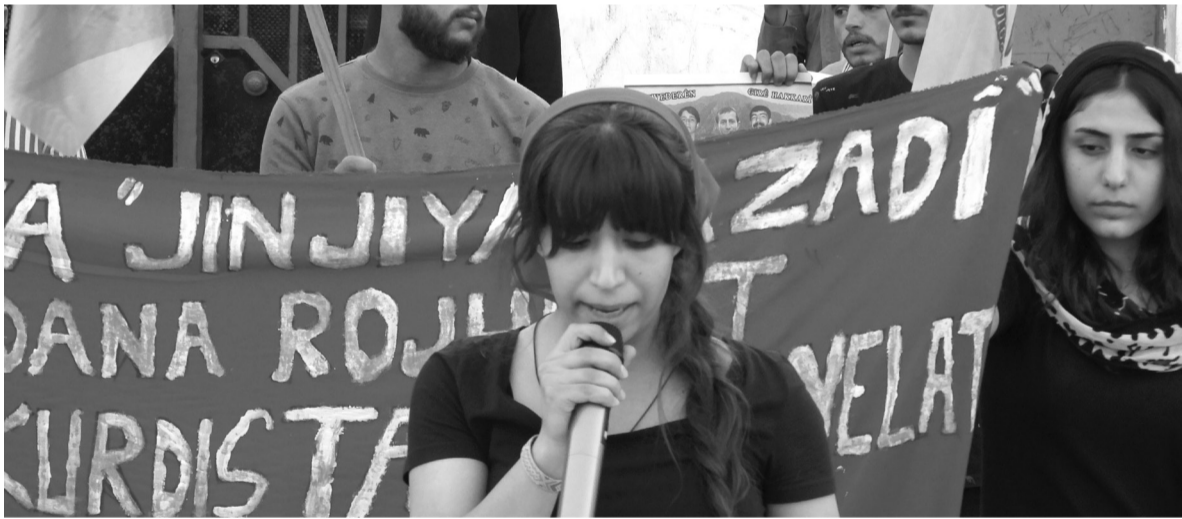
الشبيبة الشيوعية لروج آفا بذكرى انتفاضة "المرأة حياة حرة" من أجل تحية السلام لشعب إيران قامت الشبيبة الشيوعية الثورية بالقيام بنشاط امام مركز الشهيد متين دجلة للثقافة

وتتخذ الحكومة الذاتية والقوات الأمنية إجراءات يومية بكل تفران لمنع حدوث ذلك. ولكن هذا وحده لا يكفي. يجب على الشباب أن يستيقظوا ضد هذه الحرب بالذات في كل مجالات الحياة. وعلينا أن نحدد من يفعل ذلك في أحيائنا ومدننا