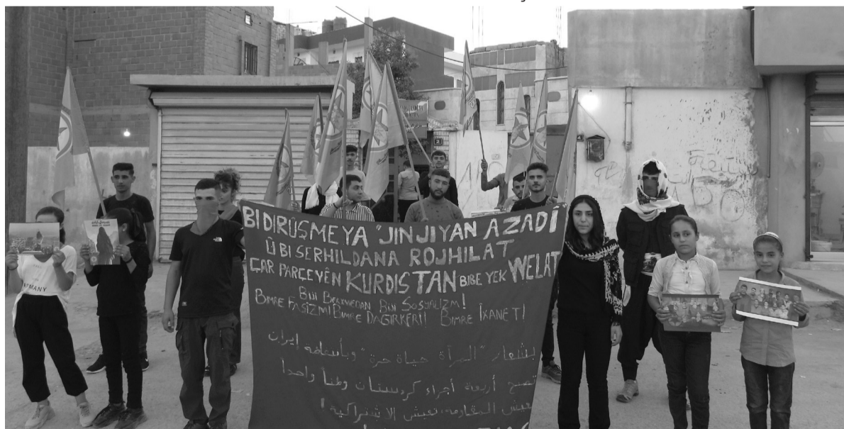
Ciwanên Komûnîst ên Rojavayî di salvegera serhildana "Jin Jiyan Azadî" de ji bo silavkirina gelê Rojhilatê Kurdistanê li ber navenda çandê ya Şehîd Metîn çalakiyek lidar xist.

Divê em gavekê jî ji axa xwe ya şoreşê ya ku me ji şehîdên xwe mîras girtiye dûr nekevin û rê nedin tu xirabiyên paşverû û qirêj ên mîna madeyên hişbir û hwd. li ser xaka şoreşê bîndestên meşandin. Rêya yekena ya azadî û jiyanekê birûmet têkoşîna li dijî dagirkerî û mêtîngiriyê ye. Ji ber vê yekê em bang li hemû ciwanan dikin ku di nava refên CKŞê de bi rêxistinê bibin.