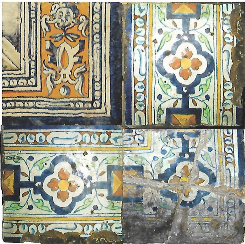
Afb. 12 Reconstructie van mogelijke omkadering van tableaus met parelrand- decor met een kader van randtegels van het type rozet in vierpas met diamantkop.

door twee bijzondere kenmerken (afb. 11a). In de eerste plaats het schilderwerk van de parelrand waar alle lijnen en de parels zelf beschadwd zijn door een lichtbruine trek, wat bij geen enkele van de overige tegels werd aangetroffen. Vervolgens het tegelnummer (afb. 11b). Het Romeinse cijfer moet een IIII geweest zijn, gezien de positie van de tegel in de rechter bovenhoek, maar links van dit cijfer staat geen hoofdletter