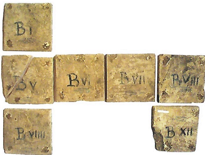
Afb. 4 Geschiedenis van Tobias, 'Tobias vangt een vis', rugzijde. Zeven tegels gemerkt met een B en een Romeins cijfer, inv.nr. V II 10,7,2.