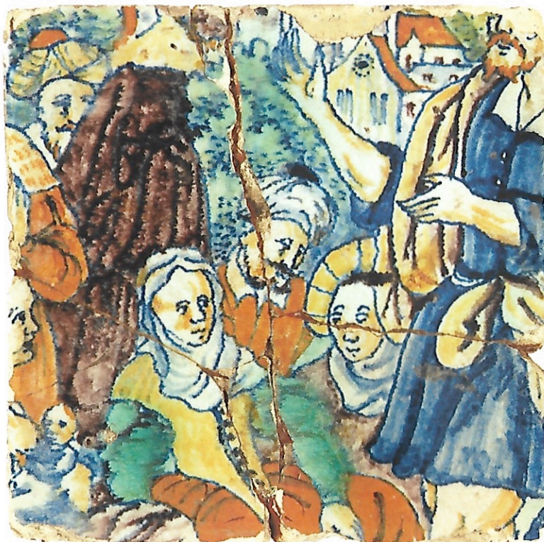
Afb. 9 'De prediking van Johannes de Doper'. Tegelperk met D VI, inv.nr. VII 10,7,5.