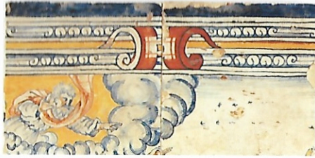
Afb. 7a Geschiedenis van Jona, 'Jona vlucht voor de Heer'. Vijf tegels gemerkt met A II, A III, A V, A VII-II, A XII, inv.nr. V II 10,7,6 en V II 10,7,7.