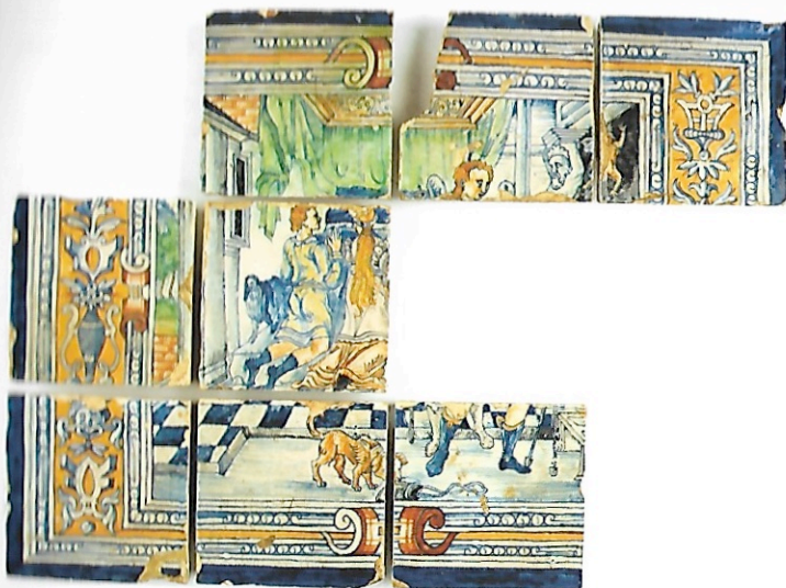
Afb. 1 Geschiedenis van Tobias, 'Tobias en Sara bidden tot God'. Acht tegels, gemerkt met een E en een Romeins cijfer, inv.nr. V II 10,7,1 (© MPMIPK).