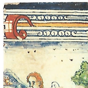
Afb. 6 Geschiedenis van Tobias , 'Raguël ontvangt Tobias'; fragment: de engel Rafaël. Tegel gemerkt C III, inv.nr. V II 10,7,7.

om een tegel toe te wijzen aan een specifieke bijbelscène. Zo toont afbeelding 6 het hoofd van de engel Rafaël met vleugels, uit de voorstelling waar Tobias door Raguël wordt begroet. Door nauwkeurige studie van de prenten van Maerten de Vos konden recent nog vijf tegels toegewezen worden aan een tableau met 'Jona vlucht voor de Heer' (afb. 7a en 7b) en een tegel aan een tableau met 'Jona wordt door een vis op het strand geworpen.' Eén losse tegel gemerkt A VI behoort tot 'Het afscheid van Tobias van zijn blinde vader Tobit' (afb. 8). Recent kon een tegel A I waarop