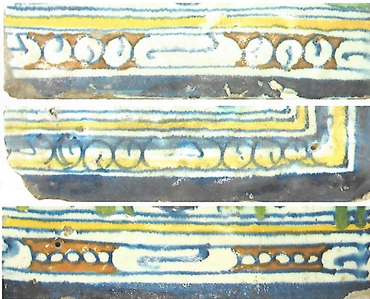
Afb. 13 Drie verschillende schilderwijzen van de parelrand.