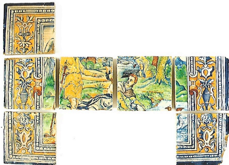
Afb. 2 Geschiedenis van Tobias, 'Tobias vangt een vis'. Zeven tegels, gemerkt met een B en een Romeins cijfer, inv.nr. V II 10,7,2.