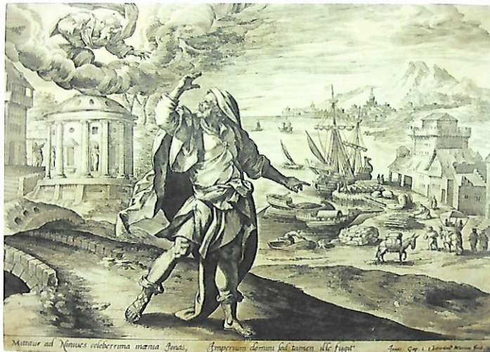
Afb. 7b Geschiedenis van Jona, 'Jona vlucht voor de Heer'. Prent van Maerten de Vos (ontwerper) en Hieronymus Wierix (graveur), inv.nr. PK.OP.10889.