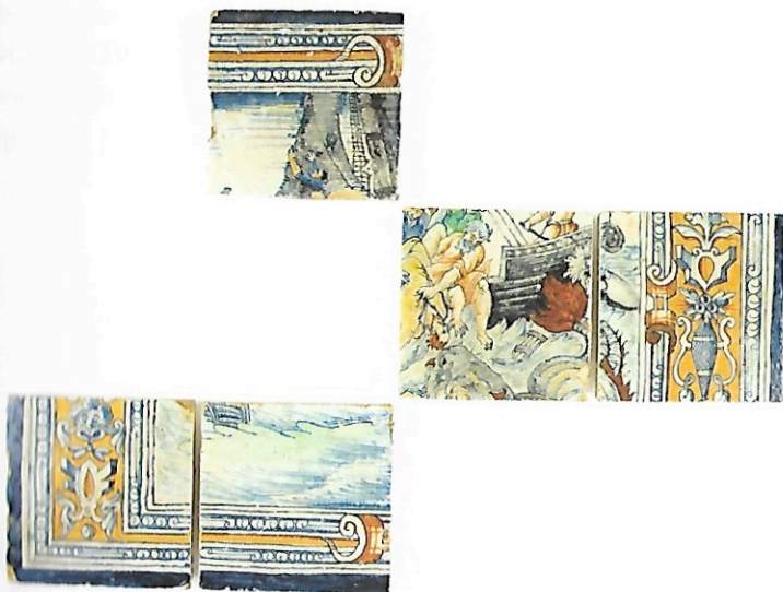
Afb. 3 Geschiedenis van Jona, 'Jona wordt in zee geworpen'. Vijf tegels gemerkt met een B en een Romeins cijfer, inv.nr. V II 10,7,4 (© MPMIPK).