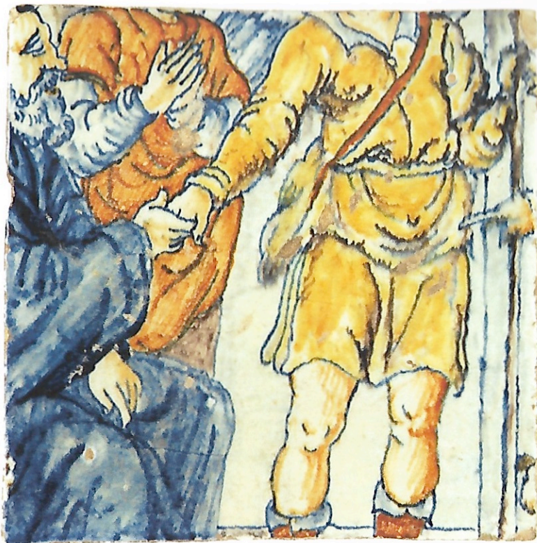
Afb. 8 Geschiedenis van Tobias, 'Tobias neemt afscheid van zijn blinde vader Tobit'; fragment: de engel Rafaël schudt de hand van Tobit. Tegel gemerkt met A VI, inv.nr. V II 10,7,7.

een strookje van de blauwe hoofddoek van Tobit is te zien, hierbij aangesloten worden. Drie tegels die hetzelfde rugnummer A XII dragen komen duidelijk uit drie verschillende tableaus.