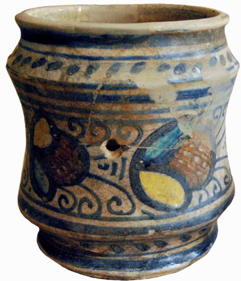
Fig. 4.2. Albarello, Het Steen, A019-1-M100, opgraving 1978, midden 16 de eeuw. Stad Antwerpen dienst archeologie. (Foto: Guy Vermeylen).