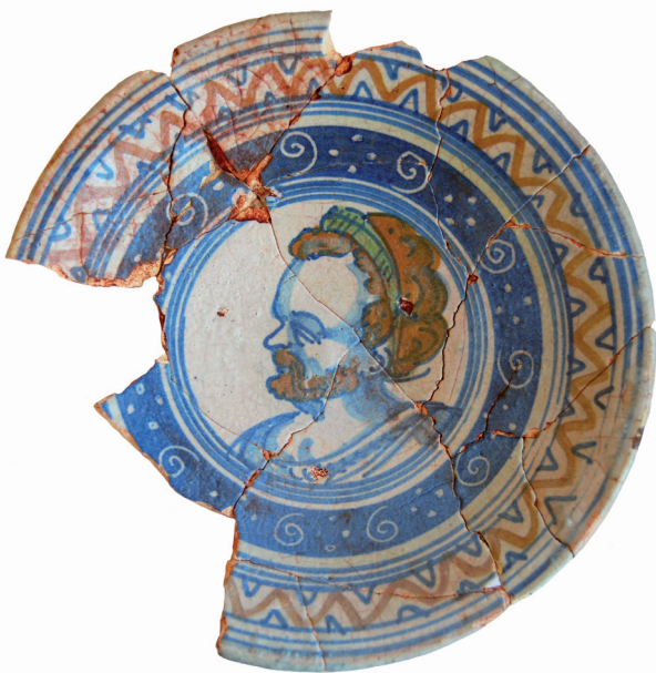
Fig. 4.1. Schotel, Vleminckveld 57, A240-3-M2, opgraving 2004. Midden 16 de eeuw. Stad Antwerpen dienst archeologie. (Foto: Guy Vermeylen).

Rond het midden van de zestiende eeuw komt een productie op gang die eerder op voorraadvorming is gericht en niet zozeer meer op bestellingen. Op tegelgebied kennen we de vele decortypes met zowel ornamentaal als figuratief decor waarmee men grote muurdelen gaat betegelen. Diverse types van schotelgoed, die men moeilijk kan situeren in de eerste helft van de zestiende eeuw, zien nu het licht. Het betreft zowel stukken voor de sier als objecten voor dagelijks gebruik. Het gamma bevat talrijke vormen van rijkgedecoreerde schotels in alle groottes en vormen, kommen, waaronder de bijzondere vorm van de papkommen, zalfpotjes, siroopkannen, albarelli en vaasjes (Fig. 4). De bijdrage van collega Leon Gyskens verder in deze uitgave zal deze types majolicaproducten illustreren aan de hand van de stukken die opgegraven werden op het Sint-Janshof te Mechelen. Was Den Salm het belangrijkste atelier in Antwerpen, het was zeker niet het enige. Wel was de majolicaproductie voornamelijk geconcentreerd in de Cammerstrate en enkele nabijgelegen straten: Aalmoezenierstraat, Schoytestraat, Sint-Jansvliet, Bogaardenstraat, Steenhouwersvest en Oever.