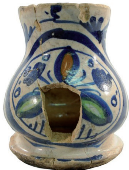
Fig. 4.3. Altaarvaasje, Bogaardeplein-Hapaerstraat, A273-252-M1, opgraving 2007. midden 16 de eeuw. Stad Antwerpen dienst archeologie.